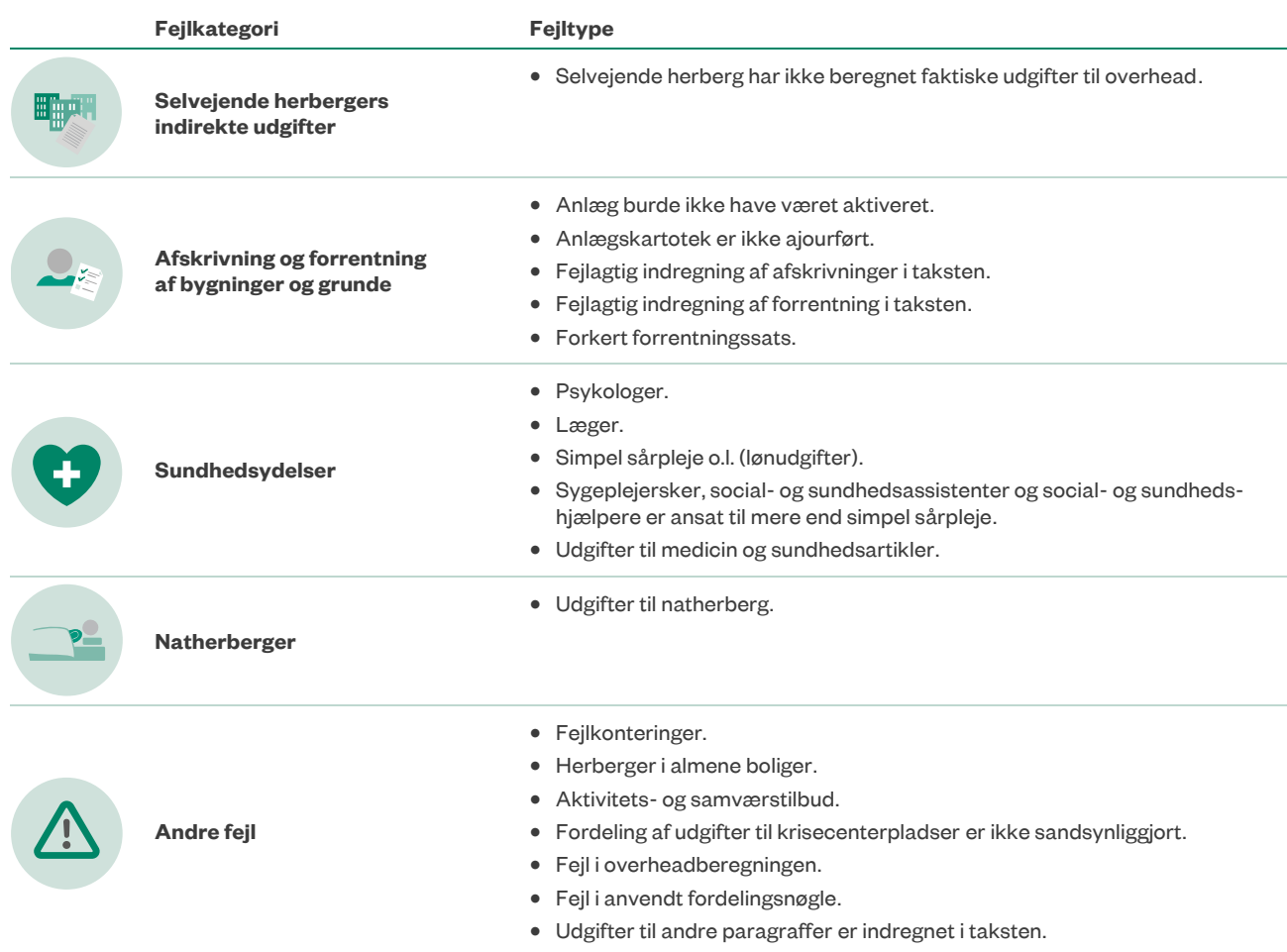
Tabel A Fejlkategorier og fejltyper i undersøgelsen