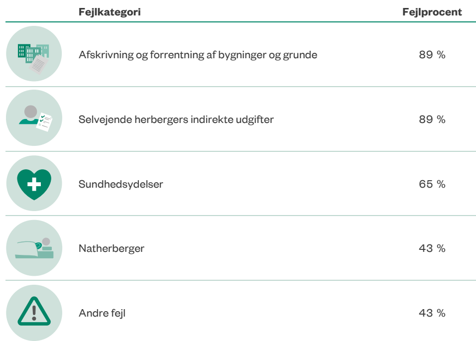
Tabel 1 Andelen af kommuner med forskellige fejl i beregningsgrundlaget

Note: N = 23 kommuner. For fejlkategorien afskrivninger og forrentninger af bygninger og grunde indgår der 19 kommuner. Det skyldes, at de øvrige kommuners herberger lejer bygninger i stedet for at eje. For fejlkategorien selvejende herbergers indirekte udgifter indgår der 9 kommuner. Det skyldes, at der er 9 kommuner, som har driftsoverenskomst med selvejende herberger.