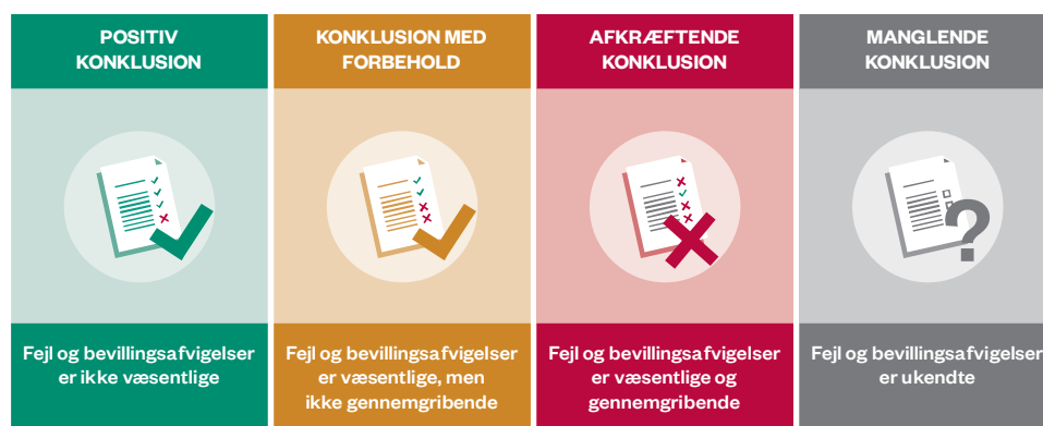
Figur 1 Rigsrevisionens standardkonklusioner

En positiv konklusion betyder, at regnskabet er rigtigt. Vi vurderer, at det samlede statsregnskab er rigtigt, hvis eventuelle fejl og bevillingsafvigelser udgør under 1 % af statens samlede udgifter og indtægter, svarende til 17,2 mia. kr. Eventuelle fejl i et ministeriums del af statsregnskabet må ikke overstige 2 % af ministeriets indtægter og udgifter og må maksimalt udgøre 1 mia. kr.