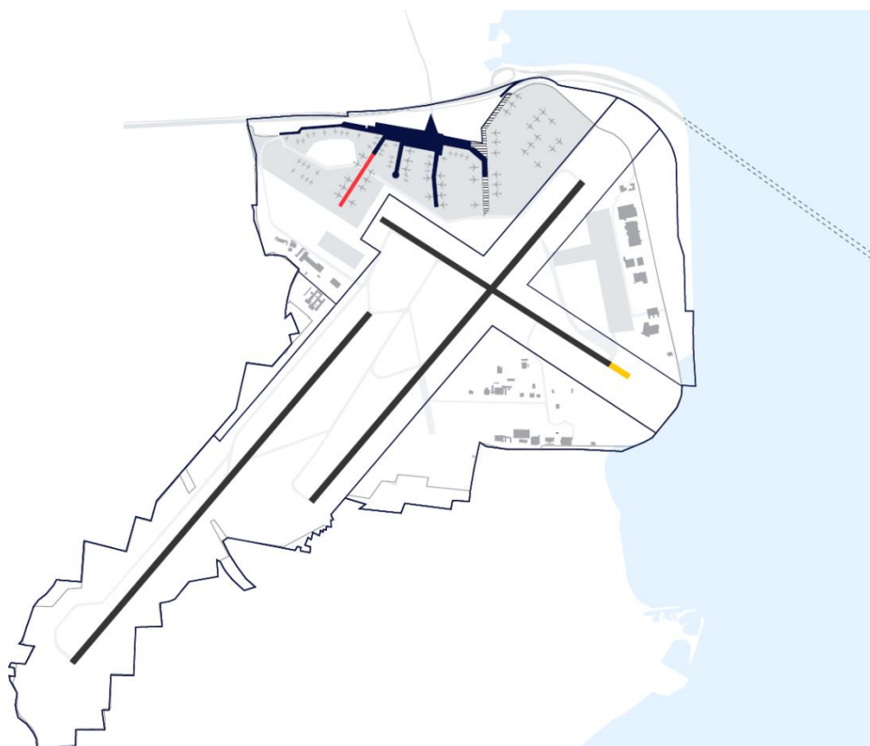
Figur 1: CPH's anbefalede udbygningsscenarie (nordlig udbygning med ny Finger A)