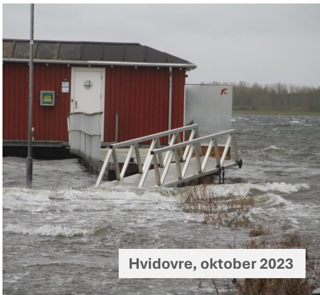
Hvidovre, oktober 2023