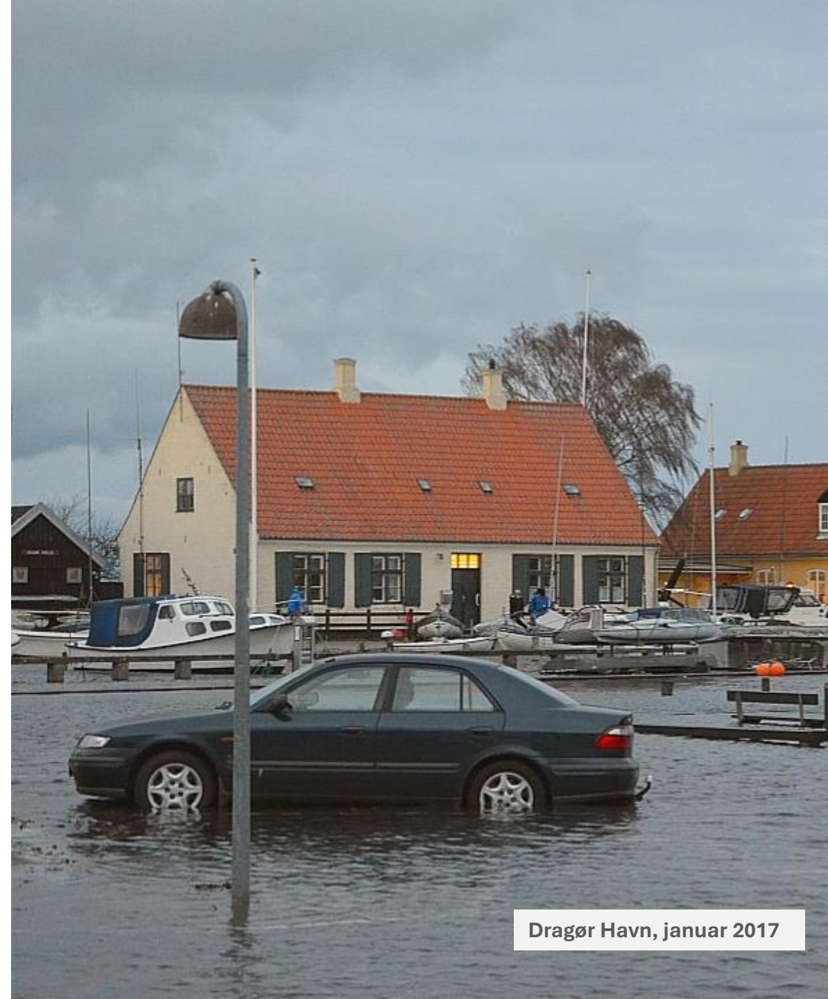
Dragør Havn, januar 2017