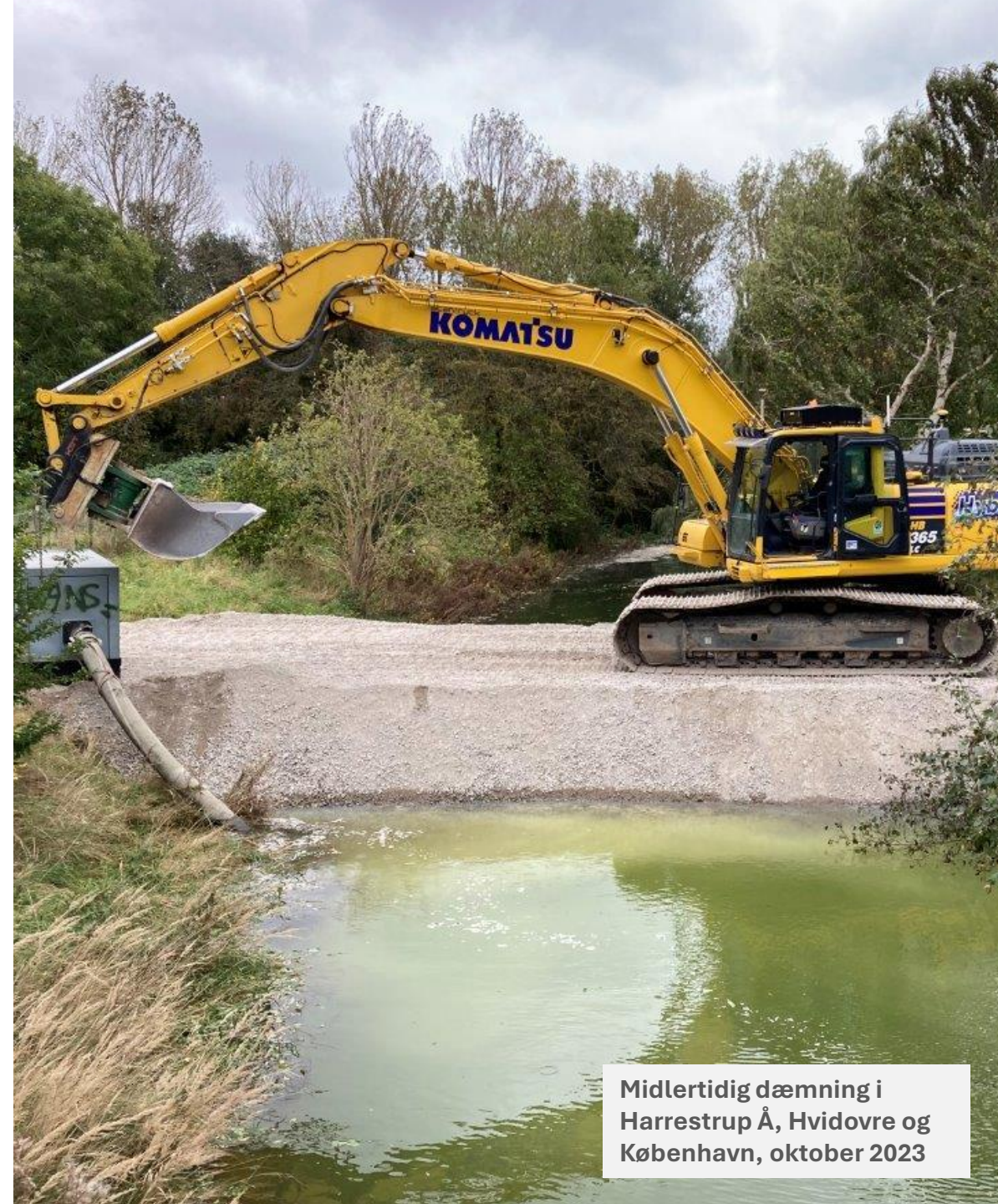
Midlertidig dæmning i Harrestrup Å, Hvidovre og København, oktober 2023