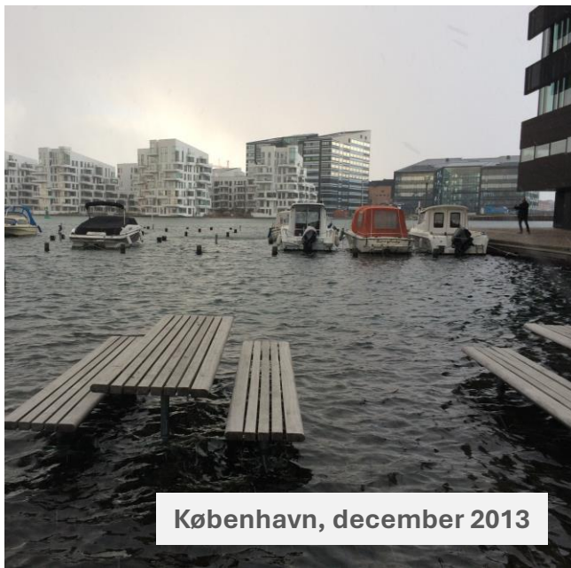
København, december 2013