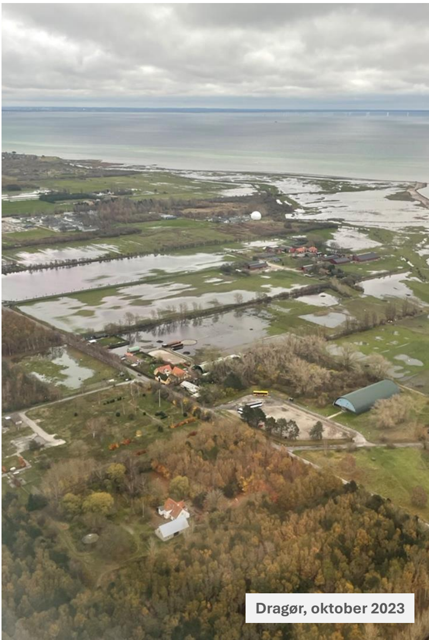
Dragør, oktober 2023