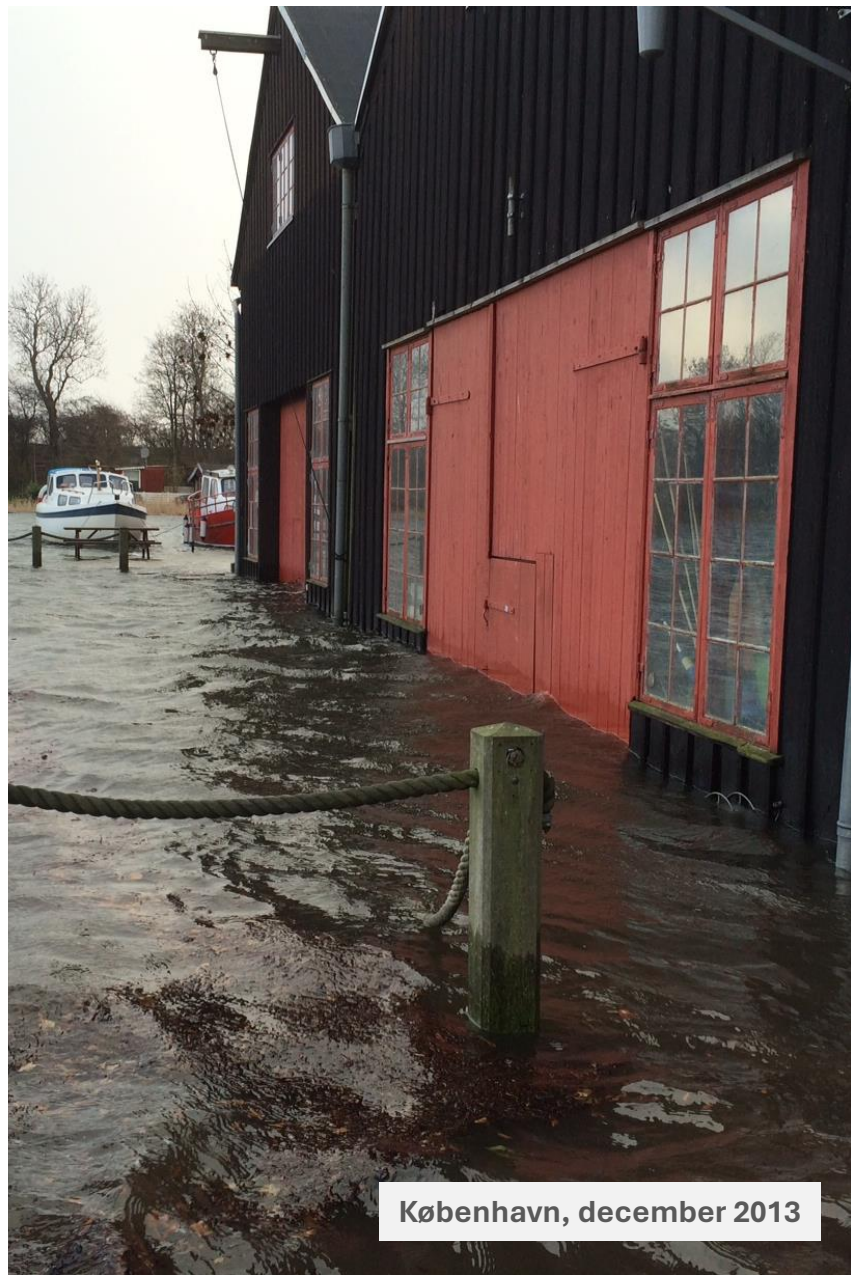
København, december 2013