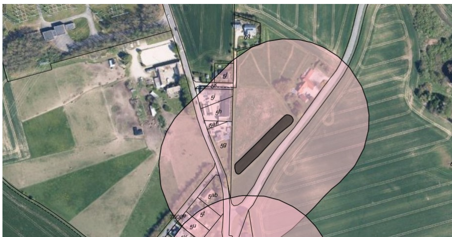
Oversigtskort af langdysse med beskyttelseslinje.

Vi vil gerne opfordre til at undersøge muligheden for at skabe en sammenhæng mellem de fremtidige naturområde i delområde 1c og langdysse på den modsatte side af Lundevej med henblik på at øge langdysseens tilgængelighed og rekreative værdi.