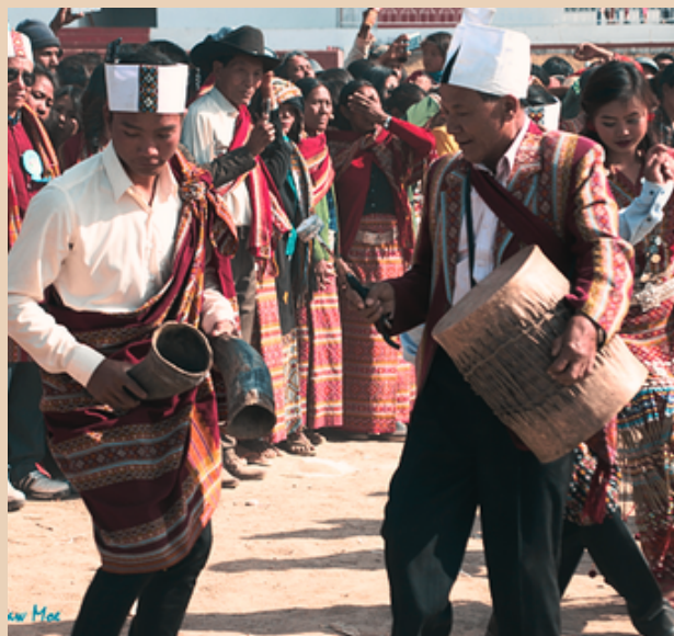
Nationaldag fejres i Hakha, Chin

Dette skete kort efter, at Chin-folket, sammen med Shan og Kachin, blev uafhængige fra Storbritannien som en del af det daværende Burma i 1948. I 1947 underskrev Chin-folket, Shan, Kachin og Burma Panglong-aftalen , som lovede en vis grad af autonomi til de etniske grupper, men denne blev aldrig fuldt implementeret.