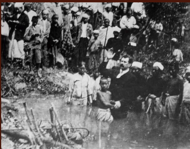
Dåb af en Chin