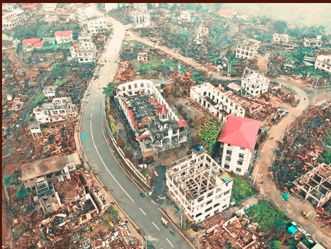
Massive ødelæggelser i Thantlang, Chin

Den 1. februar 2021 gennemførte militæret (Tatmadaw) et kup, der afsatte den demokratisk valgte regering. Dette udløste omfattende protester og øget vold. Ifølge FN er 5.350 civile dræbt, og militæret har intensiveret luftangreb, hvilket har skabt en humanitær krise. 17,6 millioner mennesker har behov for nødhjælp, 1,6 millioner er internt fordrevne, og over 55.000 bygninger er ødelagt. Flere etniske væbnede grupper har svækket militæret gennem Operation 1027, men konflikten har forværret fattigdommen. Næsten halvdelen af befolkningen lever i fattigdom, og fødevarer sikkerhed er udbredt.