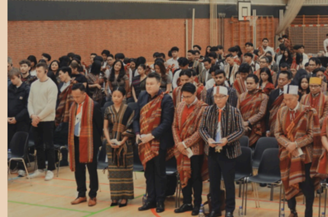
Nationaldag afholdt i Esbjerg