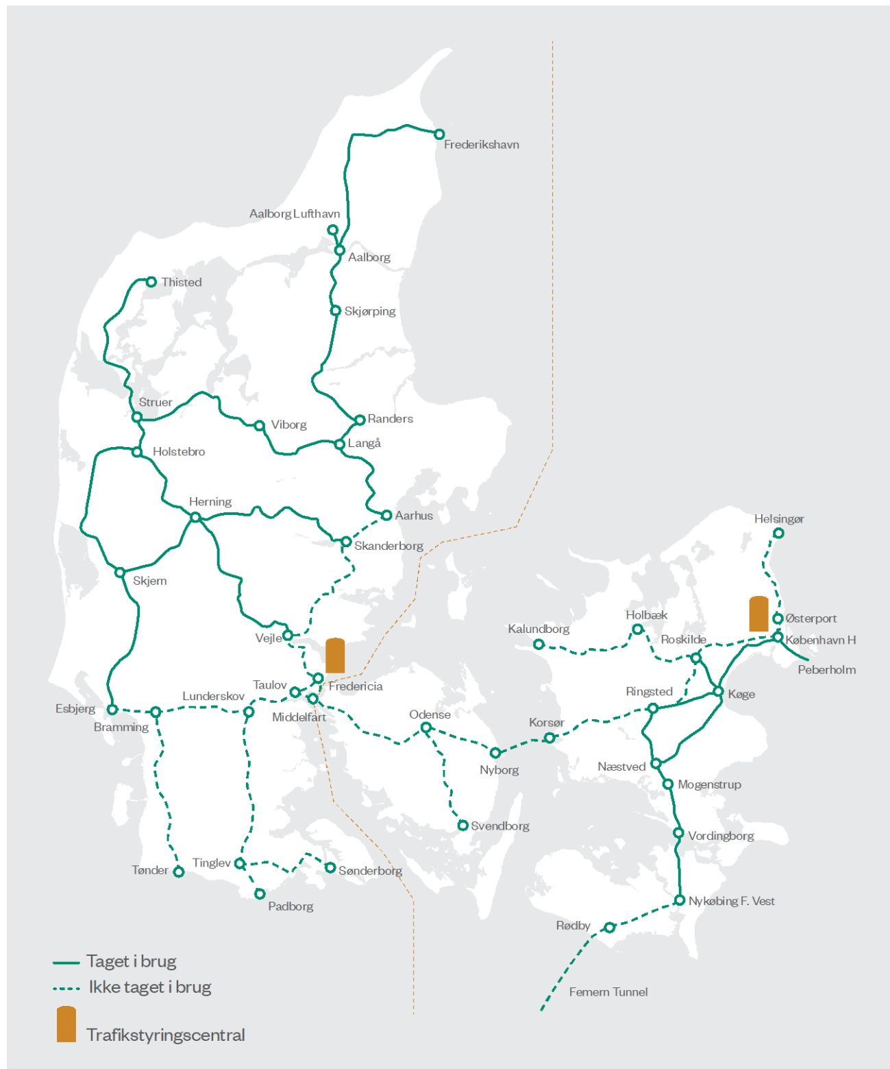
Figur 1 Status på udrulningen af signalsystemet (2024)