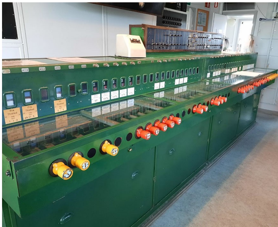
Ældre sikringsanlæg på Struer Station. Anlægget er taget ud af drift i februar 2021.

7. Banedanmark er som styrelse under Transportministeriet ansvarlig for at drive jernbanen. Banedanmark igangsatte i 2009 et projekt – Signalprogrammet – der har til formål at modernisere jernbanen. Formålet er ifølge Banedanmark at udskifte de nuværende analoge signaler, som ofte fører til fejl og forsinkelser, med digitale løsninger. Det gamle signalsystem er primært baseret på anlæg fra 1950'erne og 1960'erne. De ældste anlæg blev dog udviklet i 1912.