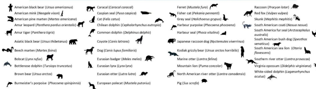
Figur 1. Påvisning af H5Nx clade 2.3.4.4b virus i pattedyr ekskl. mennesker og kvæg (4)

Med baggrund i ovenstående giver de nye oplysninger ikke anledning til at ændre vurderingen af spørgsmålene 1-3.