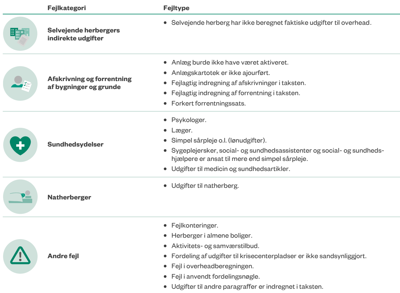
Tabel A Fejlkategorier og fejltyper i undersøgelsen