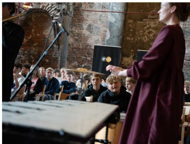
We Like We spillede koncert i Kirkesalen på Koldinghus – et smukt rum, som flere showcasegæster bemærkede som en stor oplevelse i sig selv.