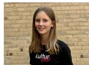
Nethe Marie Hedensted Dalby Skole, 7.B