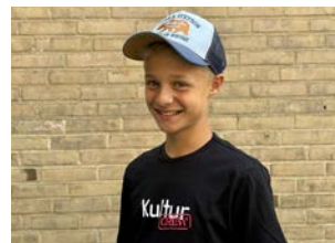
Viktor Holm Dalby Skole, 7.B