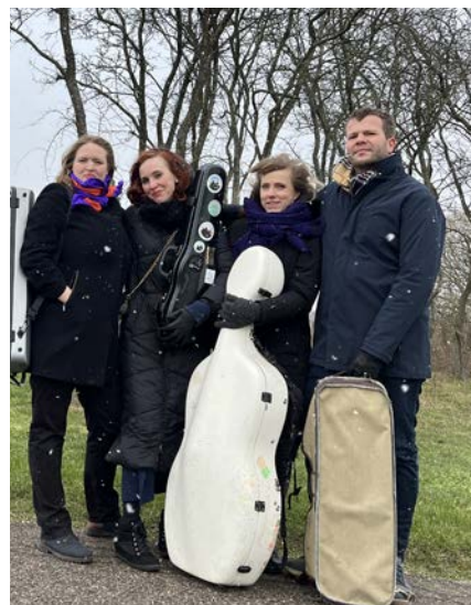
Jupiter Kwartetten spiller klassisk musik for indskoling og familier.