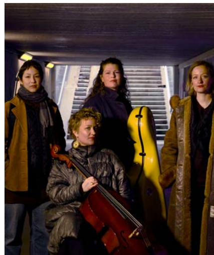
Shostakovich Strygekvartet spiller skolekoncerter for mellemtrinnet.

Udover LMS Showcase plejer Nicolai For Børn også at afholde arrangementerne Jazz For Kids og Klassisk Musik For Børn.