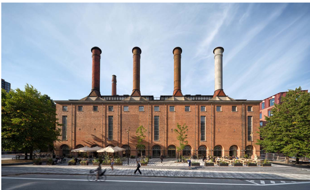
Dansehallerne ligger i hjertet af Carlsberg Byen og deler den åbne plads med en café, restaurant og bar, som er integreret i stueetagen.

Dansehallerens nye hjem, Kedelhuset, er omdannet af Mikkelsen Arkitekter og renoveret med respekt for den oprindelige arkitektur og med dansen for øje. Den tidligere industribygning er på 4.600 m 2 og rummer fem veludstyrede studier og to scener: Blackboxen, perfekt, intim og fuldt ekviperet, samt Hallen, stor, fleksibel og spektakulær. Desuden to foyerer med bar, adskillige garderober, møde- og administrationslokaler m.m. Med den centrale beliggenhed på Franciska Clausens Plads i Carlsberg Byen, hvor også tre restauranter har hjemme i Kedelhusets grundplan, er Dansehallerne let tilgængelig for borgere i alle aldre og et attraktivt mål for turister.