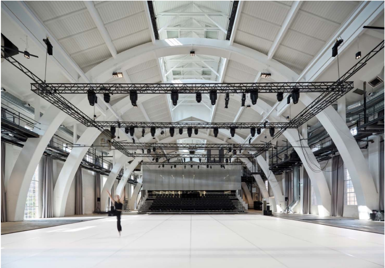
Hallens store scene og imponerende, fredede arkitektur.