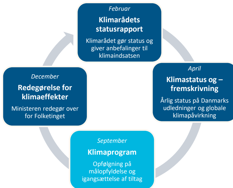
Figur 1 Klimalovens årshjul

Klimarådet slår i dette notat ned på ni elementer i Klimaprogram 2024 . Nedslagspunkterne er opsummeret på næste side og uddybes i de efterfølgende afsnit.