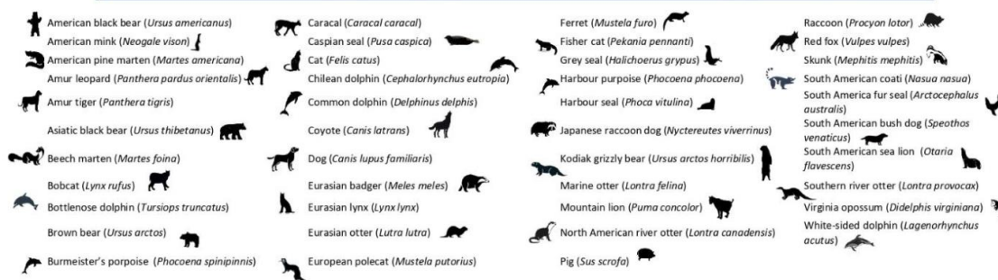
Figur 1. Påvisning af H5Nx clade 2.3.4.4b virus i pattedyr ekskl. mennesker og kvæg (4)

Med baggrund i ovenstående giver de nye oplysninger ikke anledning til at ændre vurderingen af spørgsmålene 1-3.