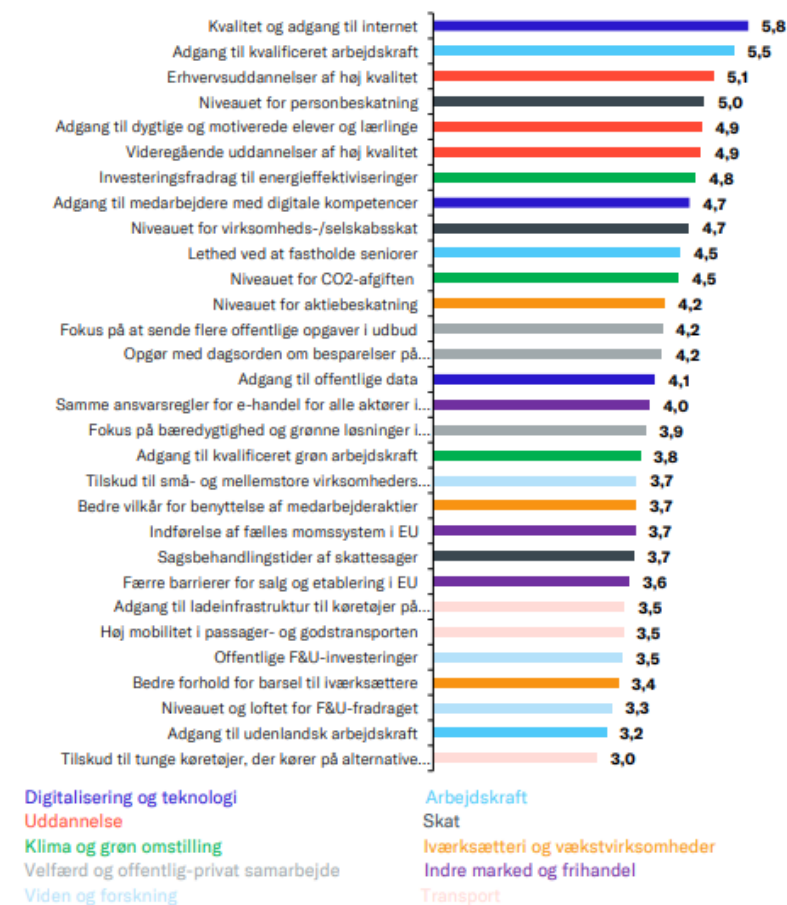
Figur 1: Hvor vigtige er følgende vilkår for, at din virksomhed har optimale betingelser for at drive virksomhed? Angiv på en skala fra 1 – 7