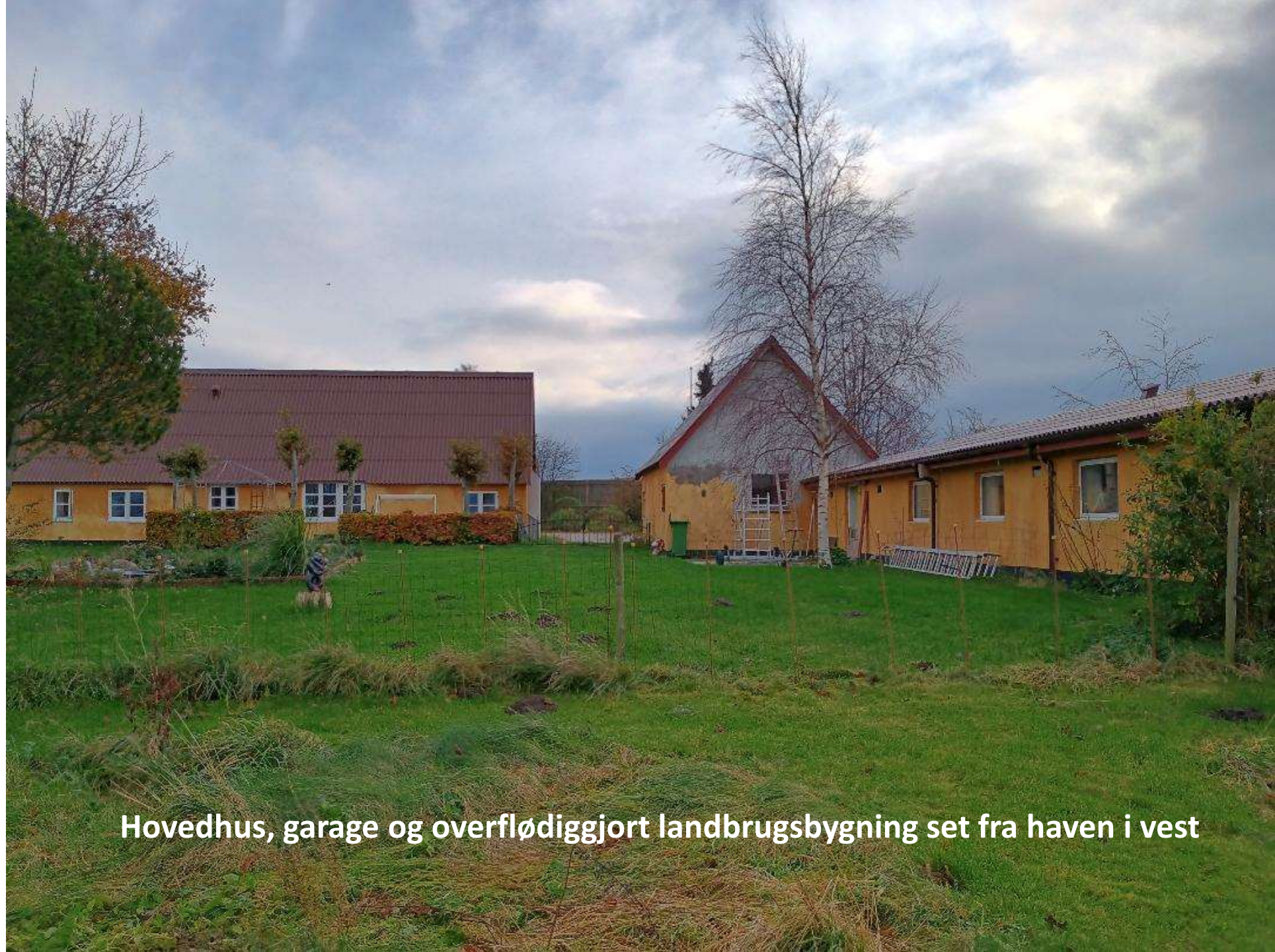
Hovedhus, garage og overflødiggjort landbrugsbygning set fra haven i vest