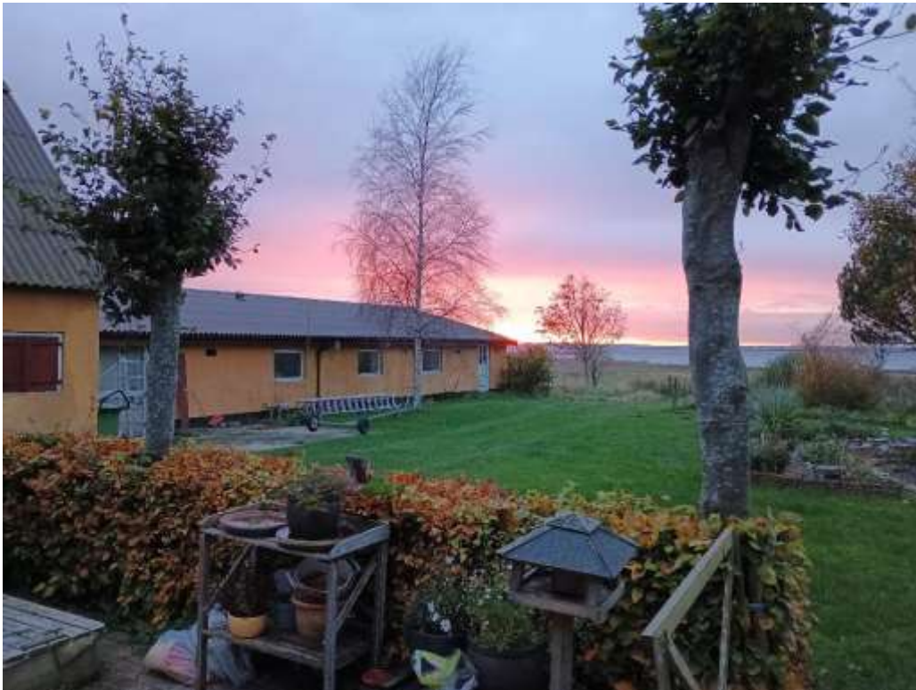
Set fra hovedhuset