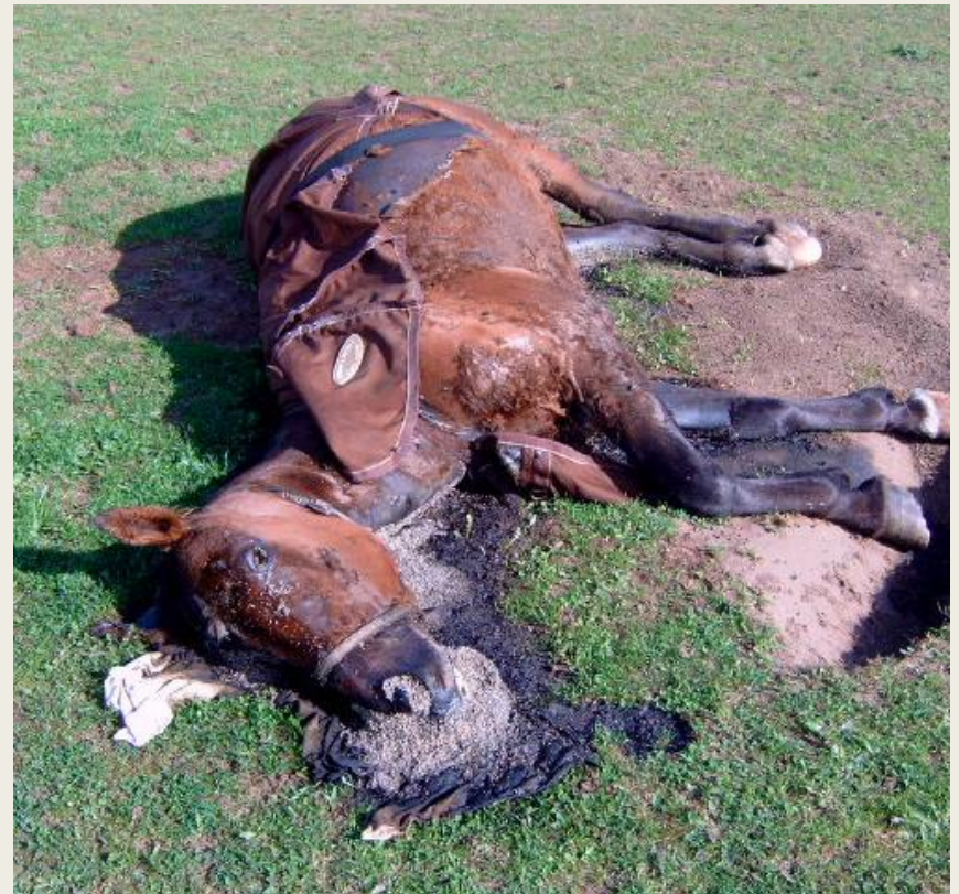
Selvdød hest på privat rideskole. Virksomheden gik konkurs