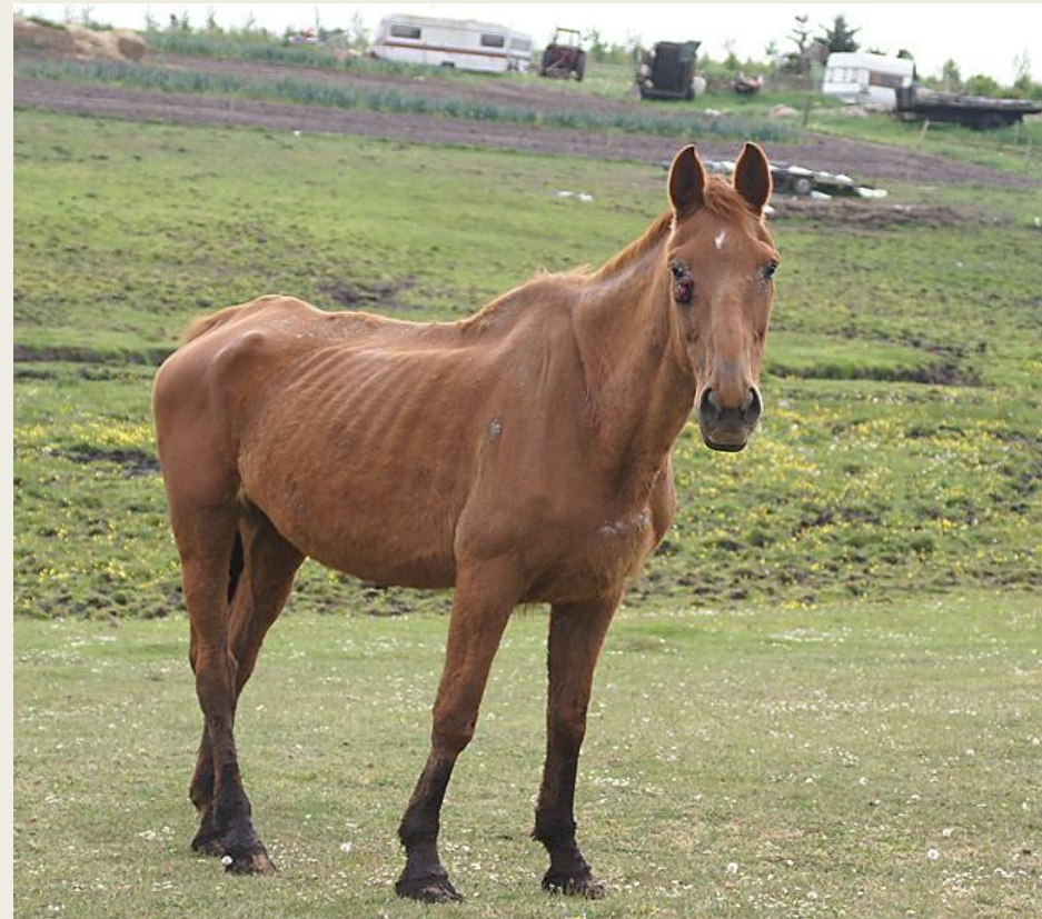
Afmagret hest, en del af større flok, der også var i dårlig stand. Avler fortsætter den dag i dag

Lange sagsbehandlingstider i retssystemet medfører nedsat straf til dyreejeren = det er næsten gratis at mishandle og vanrøgte dyr