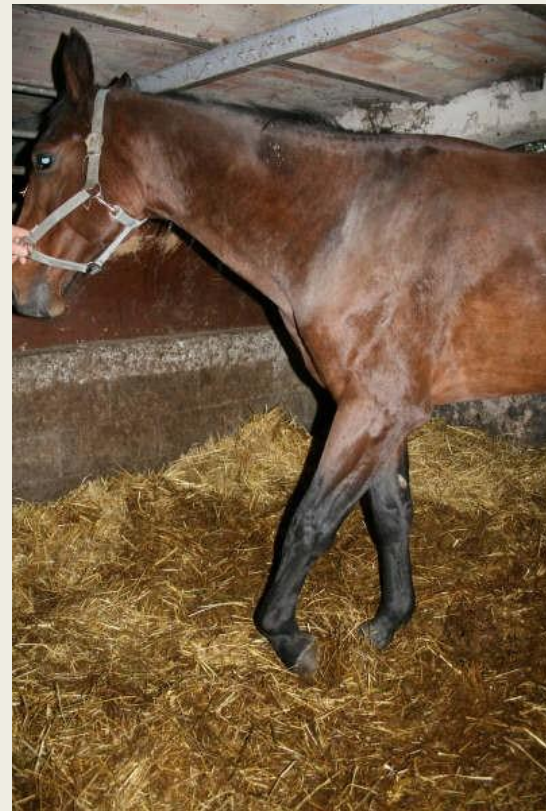
Hest med brækket ben Ejer (landmand) har ikke tilkaldt dyrlæge

Forskelligt fra politikreds til politikreds om dette accepteres!