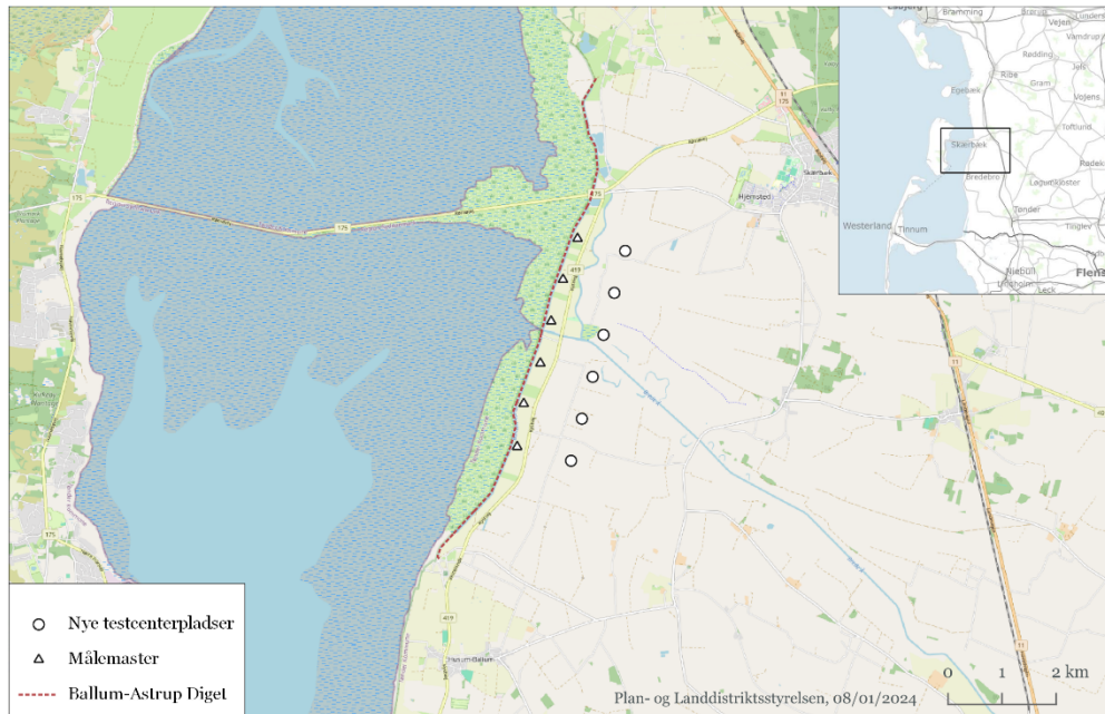
Kort 1: Kort over opstillingsscenarie for møller og målemaser i område A.1