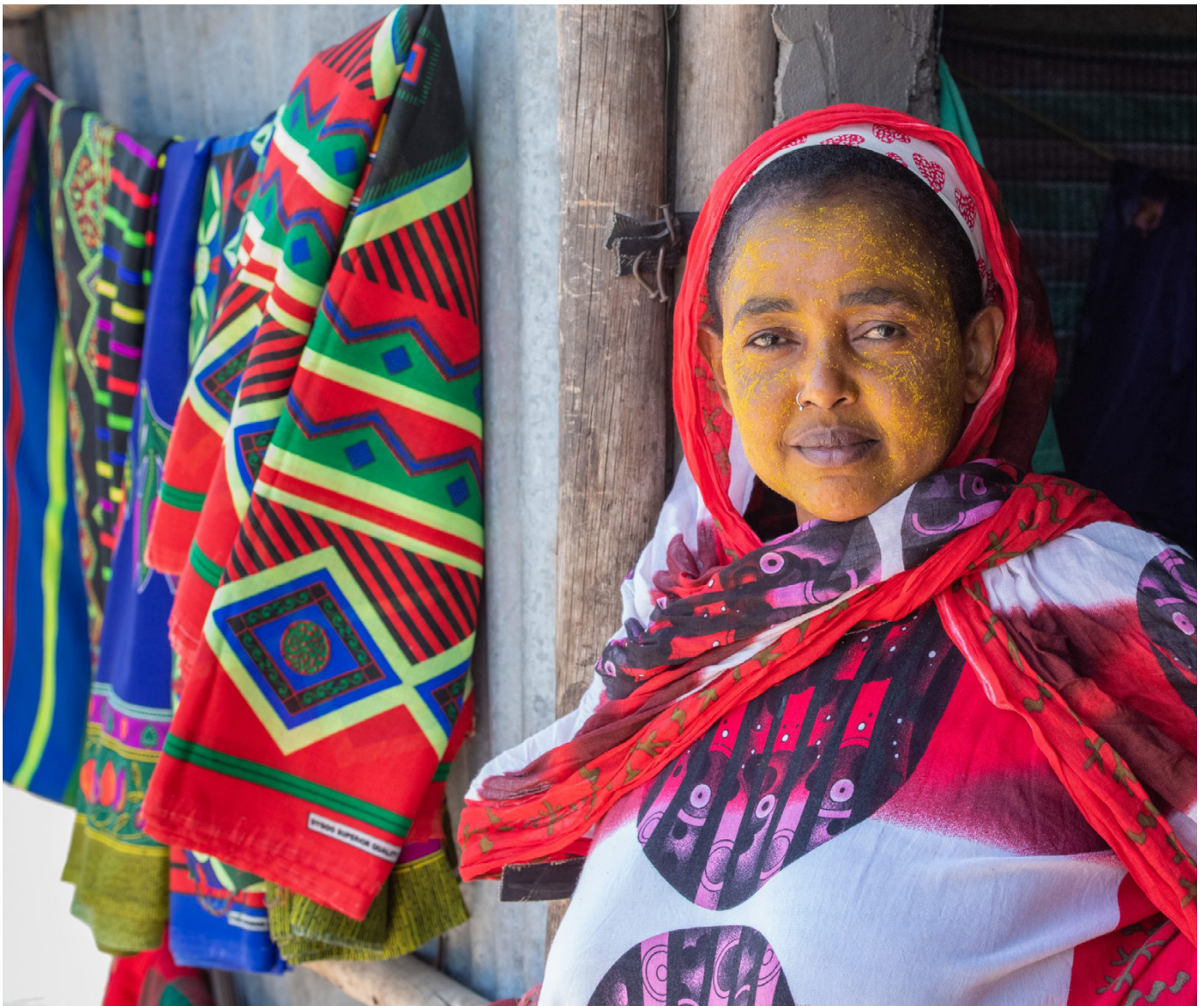
Fra en landsby nær Awash, Etiopien.

Med en geografisk placering langs den østlige migrationsrute på Afrikas Horn er Etiopien et centralt oprindelses- og transitland for irregulær migration. Omkring 382.000 grænssekrydsninger blev registeret i 2023 (heraf omkring 72 pct. udrejsende/28 pct. indrejsende), hvoraf langt størstedelen er arbejdsmigranter på den østlige rute mod Saudi Arabien (ca. 45 pct.). Flertallet af de etiopiske migranter, der migrerer til Saudi Arabien, returneres hårdhændet til Etiopien og kommer tilbage til særligt sårbare situationer, ofte udstødt af deres familier og lokalsamfund, der forventede at modtage økonomisk støtte gennem remitter.