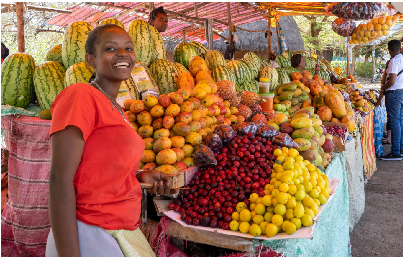
Arba Minch, Etiopien.

Etiopien er et patriarkalsk samfund og står over for en række udfordringer, hvad angår ligestilling samt seksuel og reproduktiv sundhed og rettigheder. Skadelige traditionelle praksisser, herunder børneægteskaber og omskæring af piger og kvinder, er udbredt. Myndighederne i Etiopien har taget vigtige skridt for at fremme beskyttelse af seksuel og reproduktiv sundhed og rettigheder og har reduceret mødredødeligheden med 6,5 pct. årligt fra 2000 til 2020. Andelen af fødsler med tilstedeværelse af uddannet sundhedspersonale er steget fra 6 pct. i 2000 til 50 pct. i 2019. Regeringen har også taget skridt til at forbedre lovgivningen om kønsbaseret vold, men der er fortsat betydelige mangler i implementeringen. Endeligt udestår fremskridt i indfrielsen af regeringens løfte om at stoppe børneægteskaber i 2025. Konflikten i det nordlige Etiopien forværrede eksisterende udfordringer og medførte omfattende, alvorlig og systematisk seksuel og kønsbaseret vold. Som et resultat af konflikten og den omfattende tørke fra 2020-2023 er skoler lukket og piger tvunget til at afbryde deres skolegang for at forsørge deres familier.