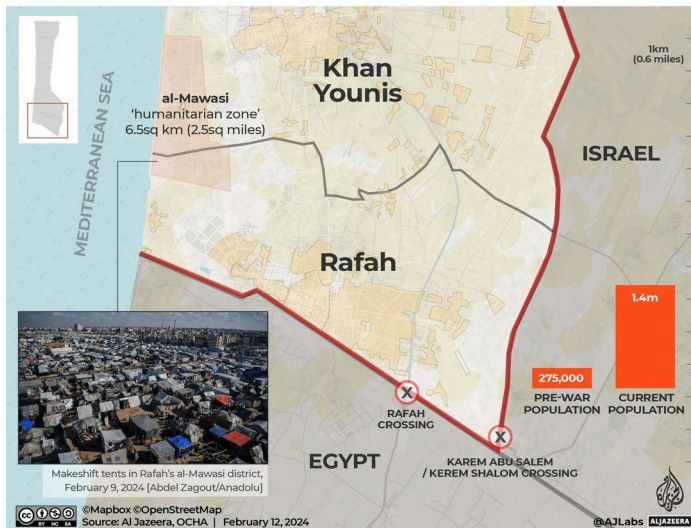
Grafik: Al Jazeera English

The Israeli army is preparing a ground attack on Rafah, a designated "safe zone" in the southernmost part of Gaza. More than 1.4 million Palestinians are sheltering in the 64sq km (25sq miles) area near the border with Egypt under dire conditions.