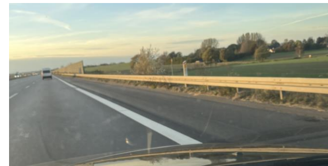
Udbygningsmuligheder på E45 ved Vejlefjordbroen Sammenfattende rapport

Der er altså rigtig god "omkostningseffektivitet" i Vejle-projektet - også uden at indregne sparede sundhedsmkostninger!