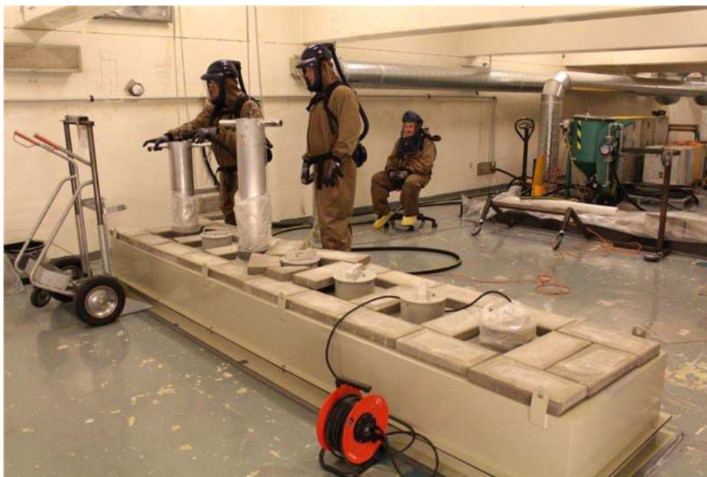
Figur 4. Fjernelse af lukkeanordninger der adskilte rummene (cellerne) på Hot Cell-anlægget under drift. Billedet viser lukkeanordningerne på etagen over selve Hot Cell-anlægget.

En oversigt over nukleare anlæg der afvikles eller er forberedt for afvikling findes i tabel 1 nedenfor.