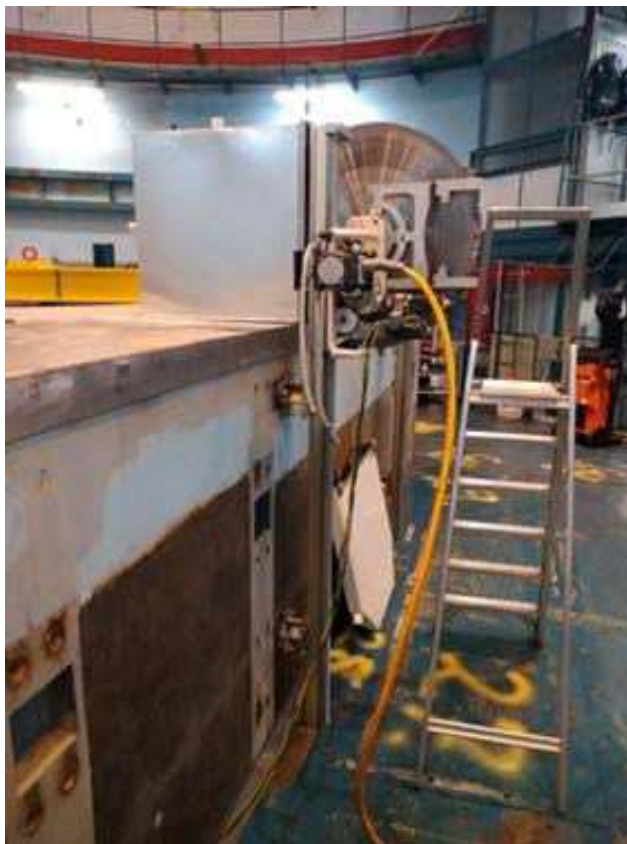
Figur 3. Opskæring af betonafskærmningen på DR 3 (2020).