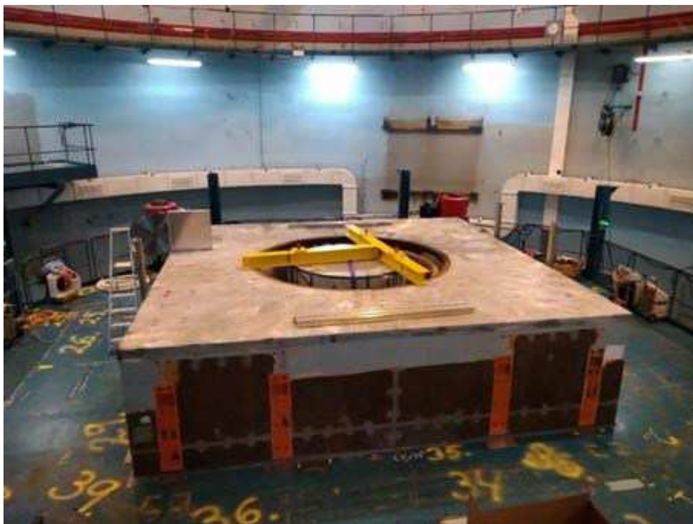
Figur 2. Opskæring af den tilbageværende betonaufskærmning på DR 3 (2020).

Afviklingen af Teknologihallen er tilendebragt, og de nukleare tilsynsmyndigheder har modtaget dokumentation for efterlevelse af krav til frigivelse med henblik på godkendelse af frigivelse af bygningerne til brug uden restriktioner.