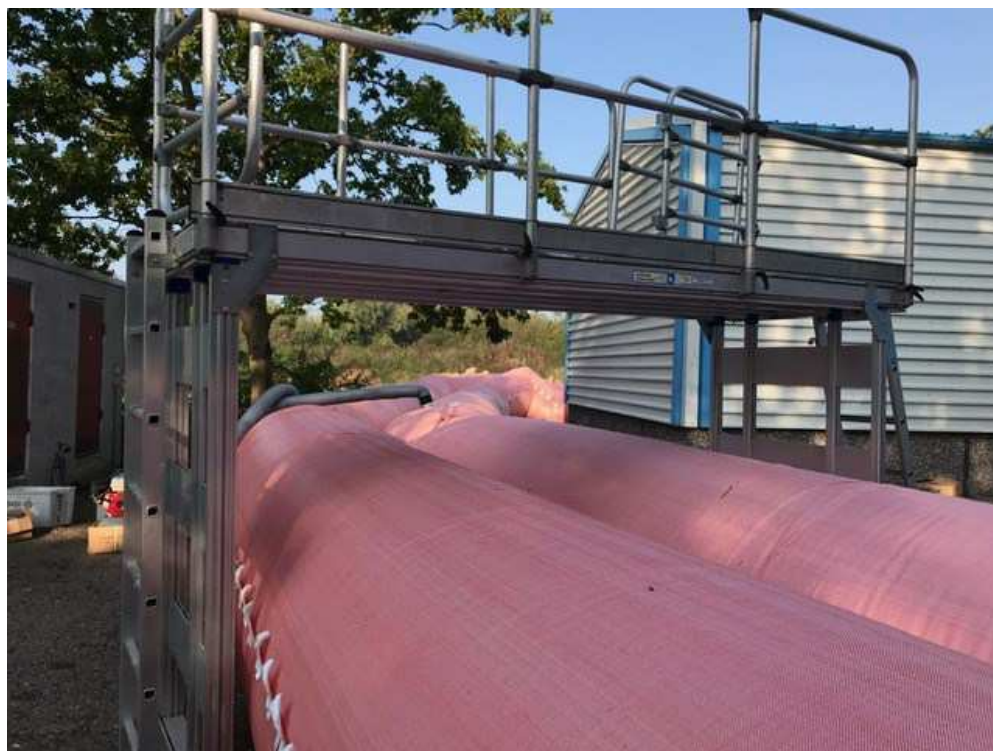
Figur 5. Udlægning af "water tube" under øvelse.