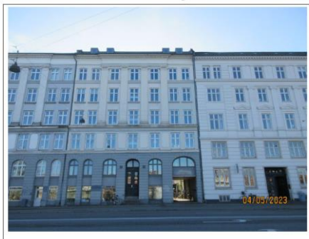
A/B Nørre Søgade 45