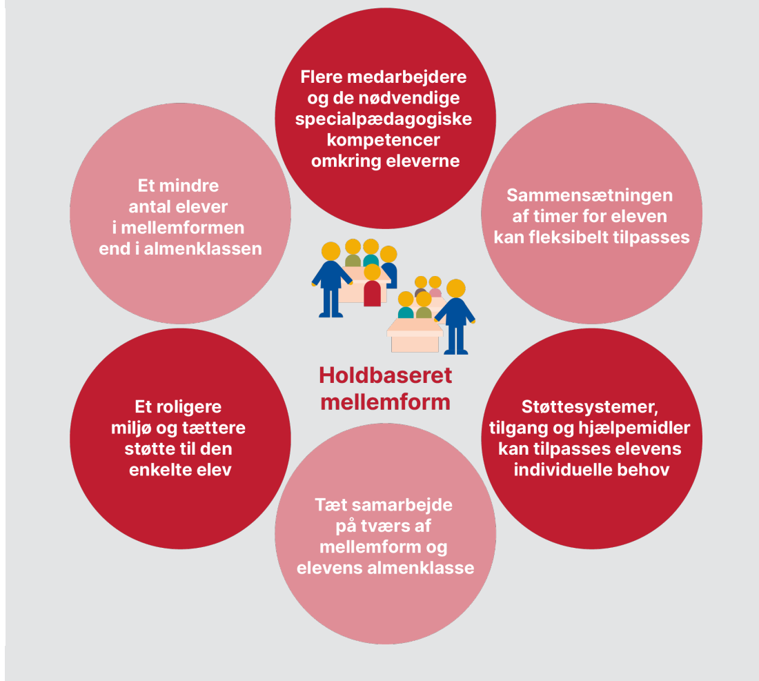
Figur 2.1 Kerneelementerne i indsatsen for holdbaserede mellemformer