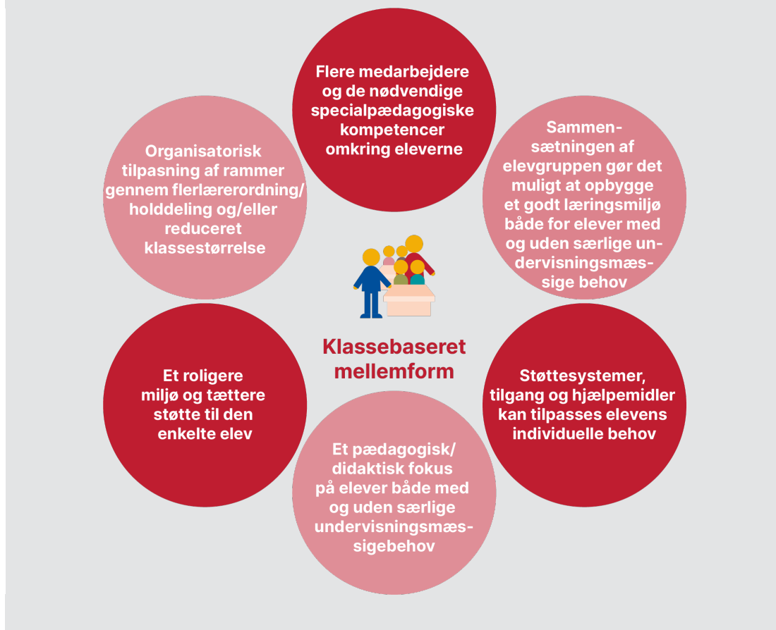
Figur 3.1 Kerneelementerne i indsatsen for klassebaserede mellemformer