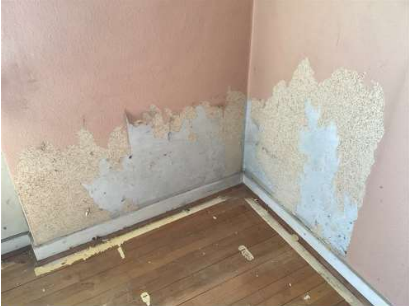
Rum: Vær. 1