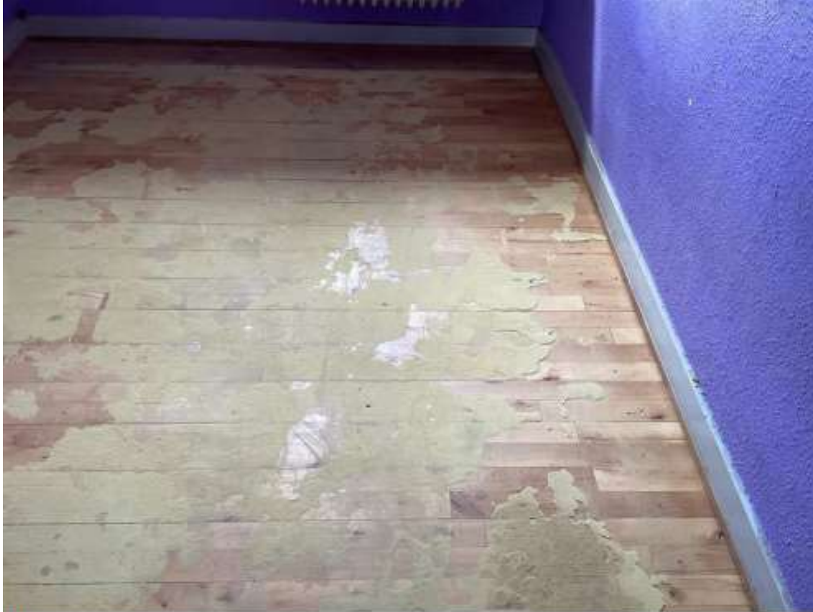
Rum: Vær. 2