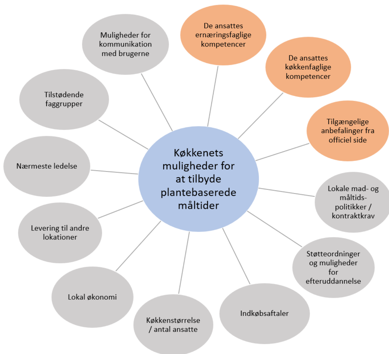
Figur 3: Faktorer identificeret som led i undersøgelsen med indvirkning på køkkenets muligheder for at tilbyde veganske eller vegetariske måltider. De orange felter er særligt uddybet i diskussionen.

Undersøgelsen kan dermed benyttes til at give nogle bud på, hvad der skal indgå i overvejelserne forud for, at der træffes en beslutning om, hvorvidt Regeringen vil gøre det muligt, at borgere altid vil kunne tilvælge et plantebaseret måltid ved offentlig bespisning.