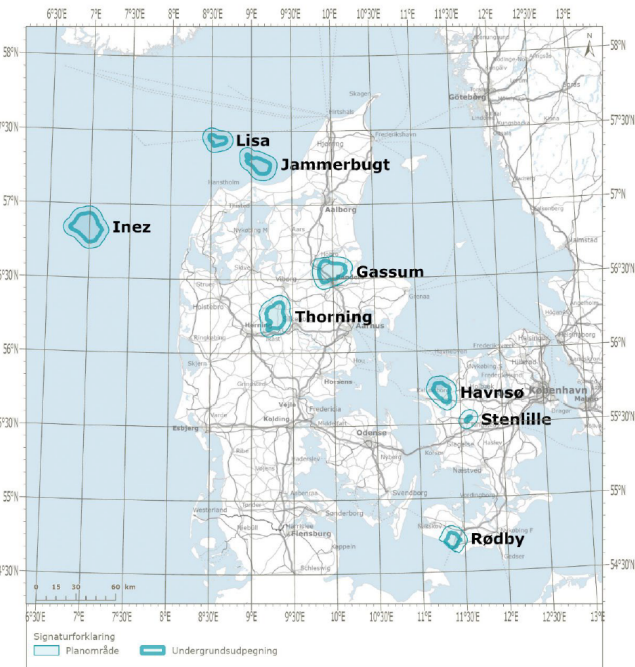
Figur 2-1 Områder i udbuddet for geologisk lagring af CO 2 .

Figur 1. Fra afgrænsningsnotat november 2022 - plan for udbud. Med de oprindelige planområder.