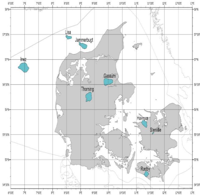
Figur 1-1 – Områder i udbuddet for geologisk lagring af CO 2 .

Figur 1. Fra afgrænsningsnotat november 2022 - plan for udbud. Med de oprindelige planområder.