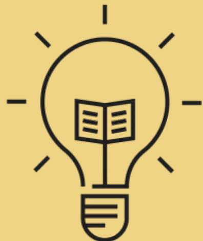
Forskning og forskningskompetenceopbygning