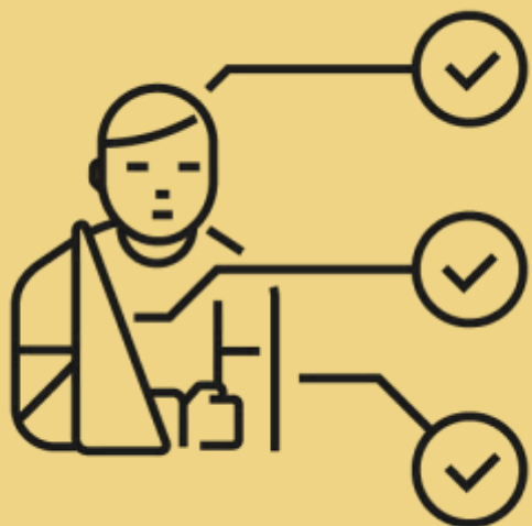
Forskningsprojekt Sundhed og ulighed i et landdistriktsperspektiv