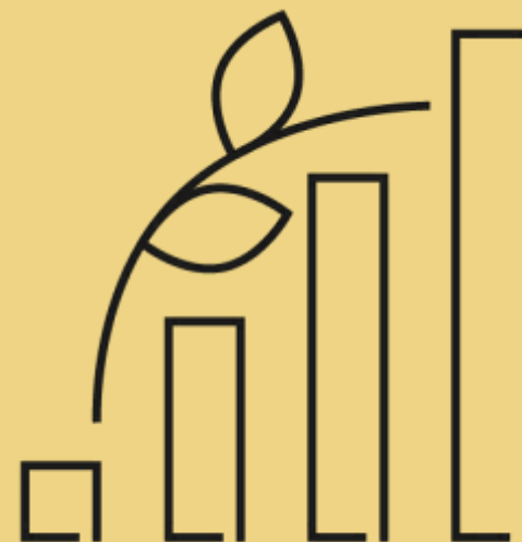
Forskningsprojekt Fællesskabsøkonomier som lokal udviklingsdynamo