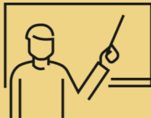
Formidling og undervisning