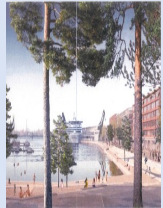
2 S/K Lynetten - Margretheholms Havn