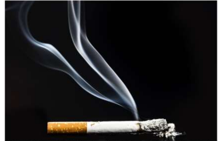
Et stykke af Vamdrup cigaretfabrik blev beslaglagt af Skatteforvaltningen i Vamdrup. De ulovlige puff bars blev beslaglagt af Skatteforvaltningen i Vamdrup.

Der er et halvt års fængsel og 50 millioner kroner i bøde, lyder dommen for arbejde på ulovlig cigaretfabrik.