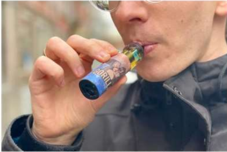
"Nyt for sale for minors," står der tydeligt på pakken. Produktet er et opulænt blødt røget, mælkedejligt, pålægs SØP-lever.