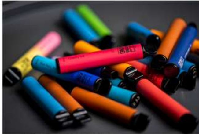
Skatteforvaltningen har siden år fører haft de ulovlige puff bars beslaglagt 21.000 puff bars.