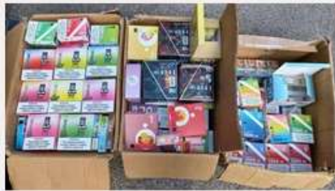
28.000 puff bars og 25.000 cigaretter blev beslaglagt.