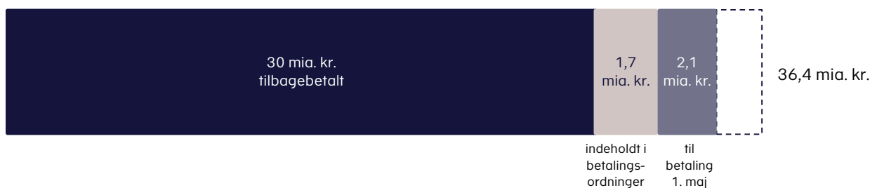
Figur 1. Oversigt over tilbagebetaling af coronalån pr. 24. april 2023

I alt er 31,7 mia. kr. betalt eller under betaling gennem betalingsordninger. Det svarer til godt 92 pct. af lånene, der har haft betalingsfrist.