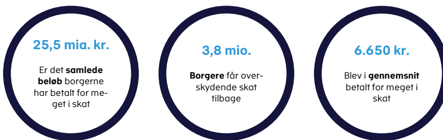
Figur 1. Nøgletal for udbetalingen af overskydende skat for indkomståret 2022.

Hver borger med overskydende skat har i gennemsnit betalt 6.650 kr. for meget.