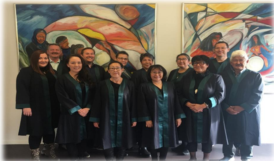
(Dommerne ved Retten i Grønland og kredsretterne)

Ligesom de kapper, der anvendes ved byretterne i Danmark, er kapperne, der anvendes ved kredsretterne og Retten i Grønland mørkeblå med et føer, der er påtrykt paragraftegn. For at markere forskellen mellem Grønlands Domstole og Danmarks Domstole, har de grønlandske dommere i 1. instans besluttet, at revers og ærmekant skal være mørkegrønne.