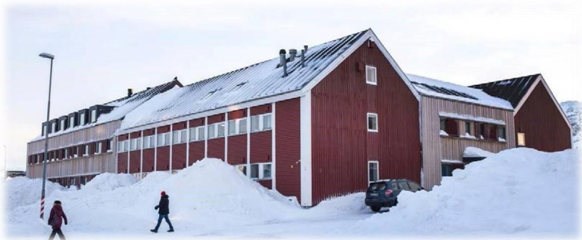
(Retten i Grønland - Nuuk)

Brug af televideoudstyr er grundet de særlige geografiske forhold i Grønland ofte anvendt ved afvikling af sager, da det kan spare borgerne for de gener, der fx er ved at skulle rejse fra sit arbejde og familie.