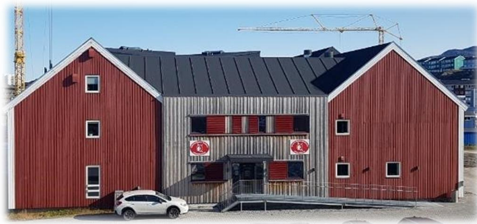
(Sermersooq Kredsret - Nuuk)

Den ekstra dommerstilling forventes i endnu højere grad gøre det muligt for Retten i Grønland og kredsretterne at fokusere på kortere sagsbehandlingstider ved kredsretterne og Retten i Grønland, ligesom Retten i Grønland vil kunne øge indsatsen for uddannelse og kompetenceudvikling af blandt andet kredsdommerne og kredsdommerkandidaterne samt retssekretærene.