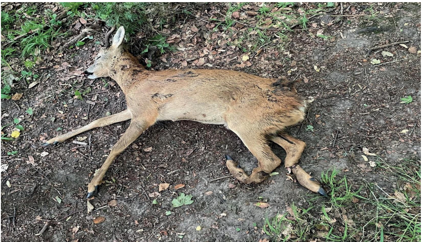
Figur 1 Påkørt Råbuk. Anmelder er en privat borger som er ude og gå en tur. Af skaderne fremgår det at dyret er påkørt for flere dage siden. Vi fik sporet dyret op og fik det aflivet.

Der har nemlig været en voldsom udvikling i antallet af trafikpåkørsler. I 1998 havde man omkring 1000 påkørsler og 2021 omkring 7688 påkørsler. Til sammenligning havde man i 1990 kun 82. Med flere biler på vejene, er det kun logisk at antage at antallet af påkørsler stadigvæk er stigende.