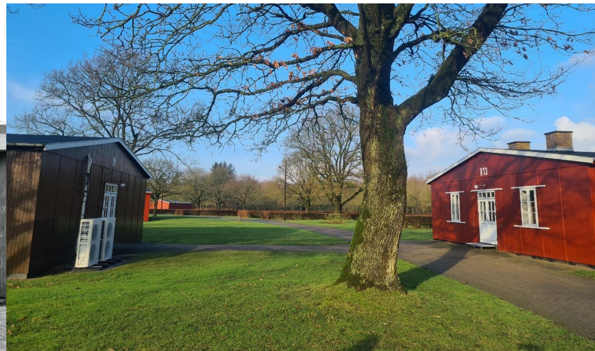
Tilbageværende barakker H 4 , H 3 og H 13 i 2023