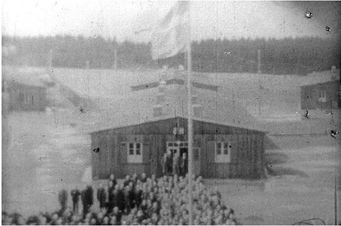
Illegalt foto af indsmuglet flagstand og Dannebrog – Frøslevlejren d. 4. maj 1945

Frihedsmuseet fik efter branden i 2013 63,7 mio. kr. af et enigt Folketing til genopbygningen