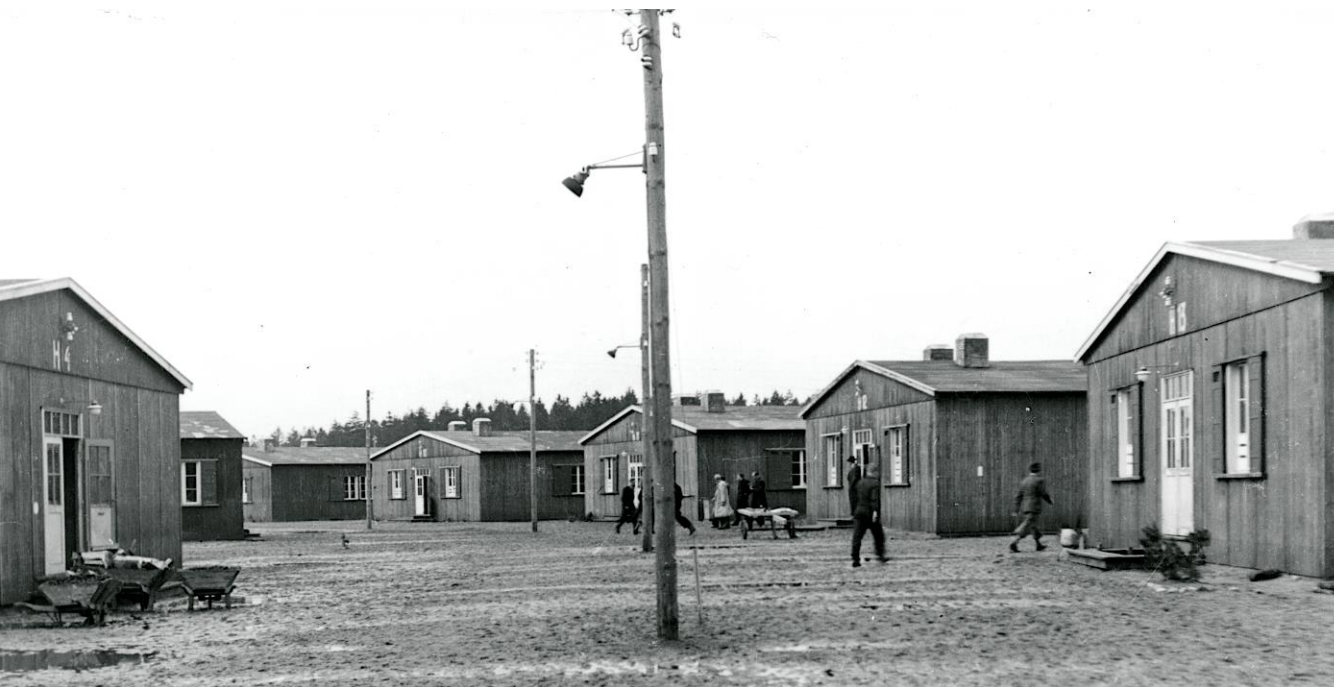
Barakker H 4 , H 3 og H 9 - H 13 i 1944