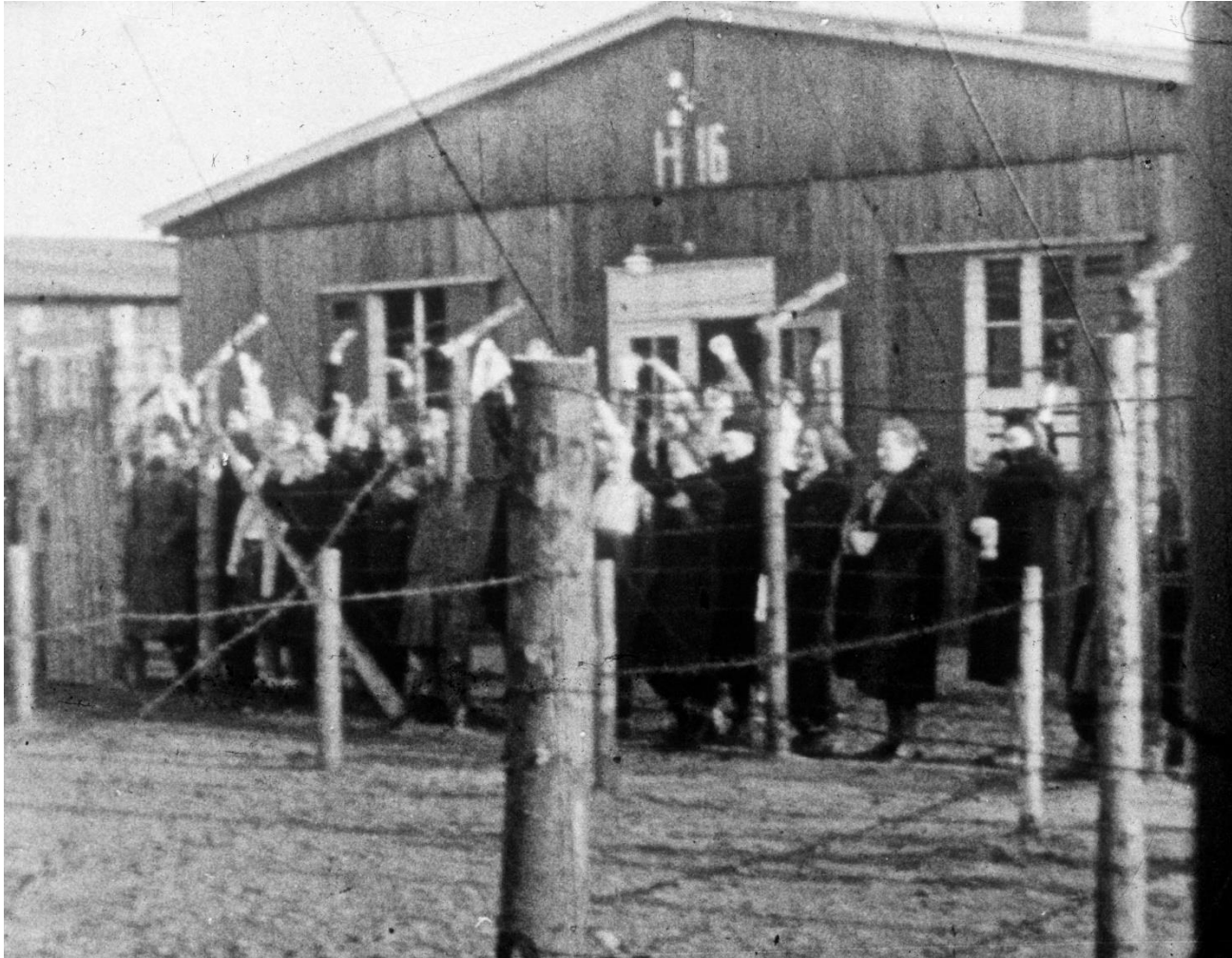
Illegalt foto af kvindebarakken H16

Autentiske besøgssteder er øjenvidner fra historien, og formidler dens budskaber bedst