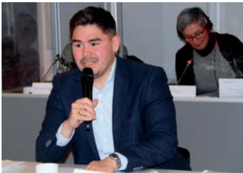
Formand Ineqi Kielsen