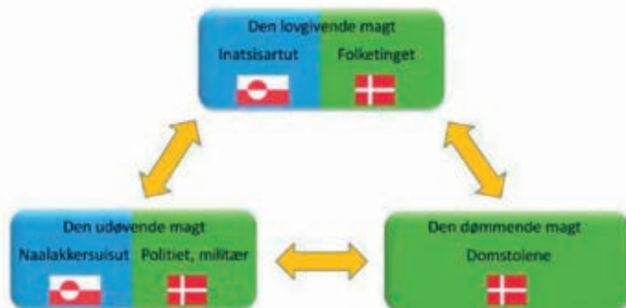
Figur 3. Illustration af magtens tredeling i Grønland med involvering af to forskellige magthavere. Det er dels den grønlandske magt (markeret med blå), dels den danske magt (markeret med grøn) (Hansen 2017,36).