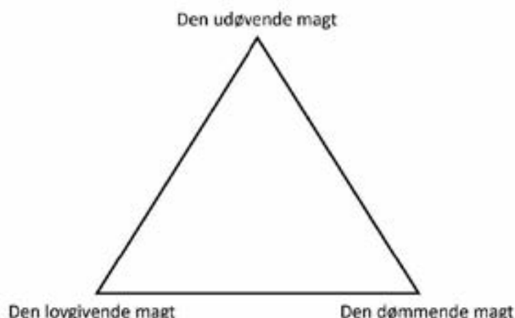
Figur 2. Magtens tredeling. De tre magter er adskilte fra hinanden for at undgå en magtkoncentration, som historisk har vist sig ikke at være til gavn for befolkningen.

hjemmestyret – fra 1979 til 1998 – var der ingen adskillelse mellem Landstinget (den lovgivende magt) og Landsstyret (den udøvende magt). Landsstyreformanden var både formand for parlamentet og formand for regeringen. I et reelt parlamentarisk system kan de to poster ikke besættes med en og samme person.