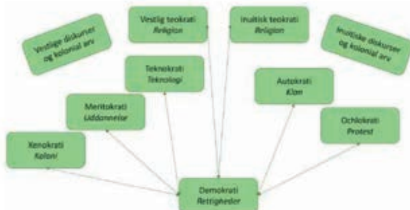
Figur 5. Model for forskellige påvirkninger af demokratiet i nutidens Grønland (Hansen 2017,111)

Ses vores styreform i en bredere kontekst, hvor også udformningen af central-administrationen indgår, så er det endnu mere tydeligt, at vi har et ungt demokrati. Figur 5 giver en illustration af de mange forskellige principper for styreformer, som i større eller mindre grad påvirker den måde, hvorpå vi udøver vores demokrati.