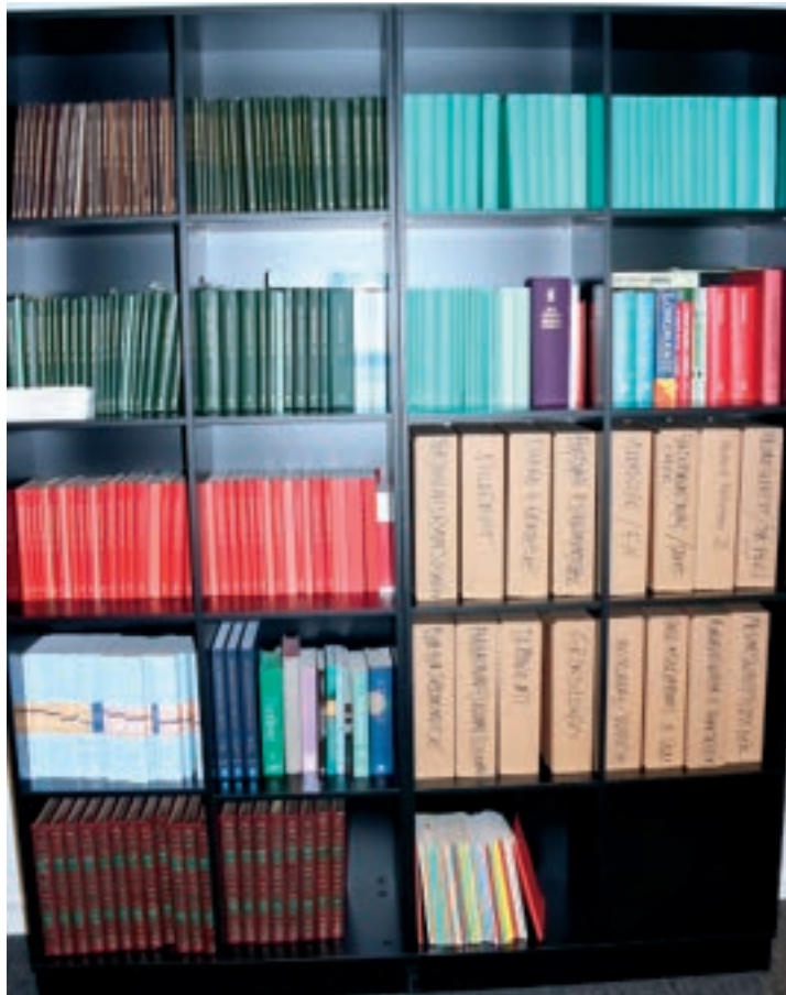
Isumallioqatigiissitat Inatsisit katersugaataasat ilaat