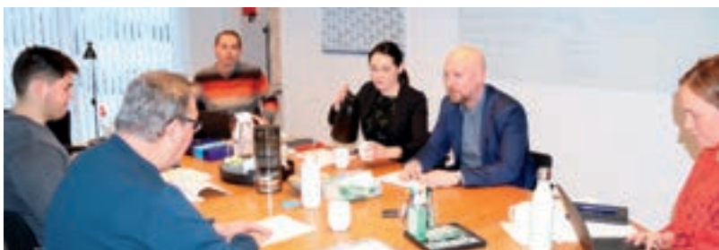
Formandskabet for Forfatningskommissionen møder Formand for Naalakkersuisuts juridisk afdeling for at drøfte anmærkninger til udkastet