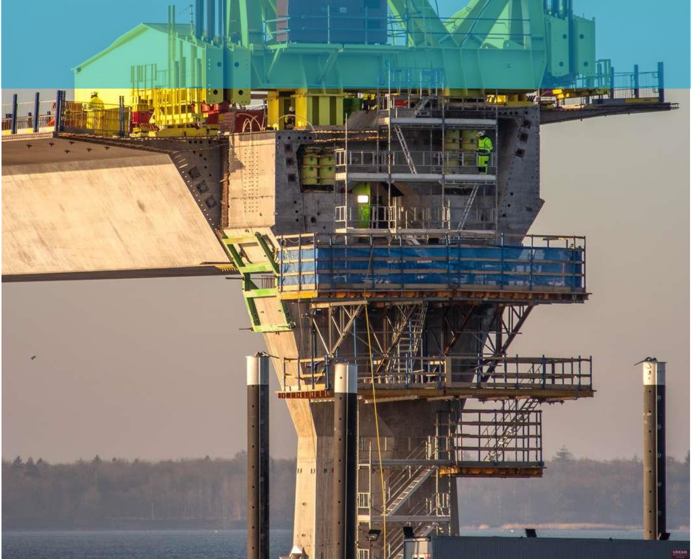
Brodrager på Storstrømsbroen