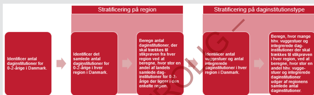
Figur 3.1 Proces for stikprøveudtagning, daginstitutioner for 0-2-årige