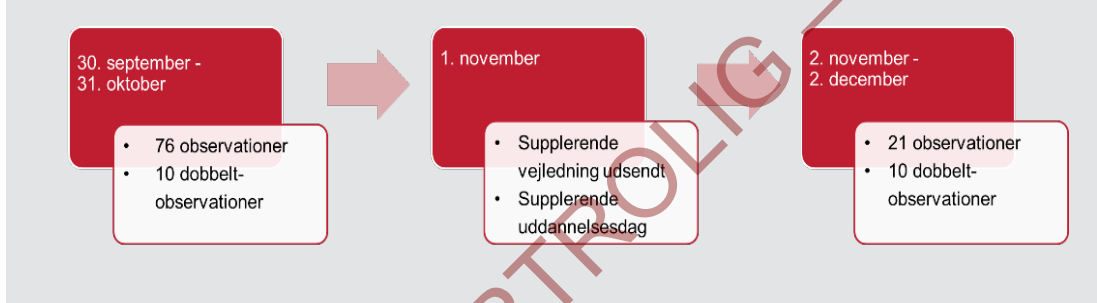
Figur 5.2 Observationer i daginstitutioner for 0-2-årige, antal daginstitutioner. Der er gennemført observationer på to stuer i hver daginstitution