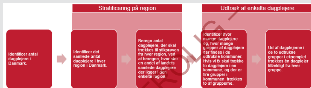
Figur 3.2 Proces for stikprøveudtagning, dagplejere