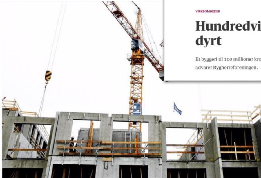
Byggesjusk har kostet samfundet 50 milliarder kroner til reparationer, tabt arbejdsfortjeneste og dårlig livskvalitet.