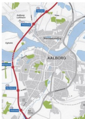
Figur 1. Kort fra VVM-redegørelse 2021

Med anlægget bliver Aalborg, som vist på kortet nedenfor, omkranset af to store firesporede motorveje, hvoraf den nye Egholmmotorvej jo ligger vest for byen, med det resultat at når vinden blæser fra vest og nordvest, vil store dele af Aalborg Vest- og Midtby blive generet af støj. Støjdæmpning på Egholmmotorvejen vil mange steder være umulig, idet store dele af anlægget forløber i 6 – 10 m højde over jorden.