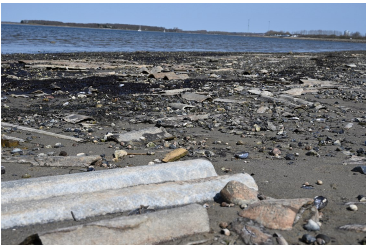
Figur 2. Foto fra Hasseris Enge

Dansk Eternit Fabrik, grundlagt i 1927, stod for 90% af importen af asbest til Danmark, og vedblev med at importere og bruge asbest indtil 1985, i de senere år op til 15.000 tons årligt. Fra 1976 fik Aalborg Kommune tilladelse til at dumpe affald fra Dansk Eternit Fabrik, indeholdende asbest, i Limfjorden. Ganske vist blev tilladelsen givet på betingelse af at der skulle etableres en sikring i form af en solid stenindfatning mod fjorden inden påbegyndelse af deponi, men denne stenindfatning blev først opført adskillige år efter at deponeringen var påbegyndt, og i mellemtiden kan store mængder af asbest være sivet ud i fjorden. På foto, figur 2, ses det uddrag af Limfjordskysten på Aalborg-siden, med Egholm i baggrunden, hvor sænketunnelen fra Aalborg til Egholm skal udgraves.