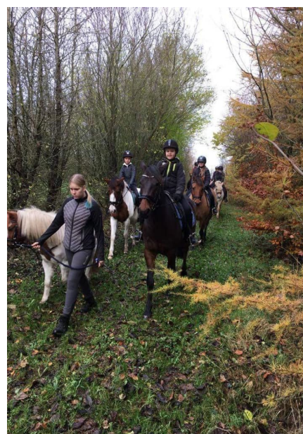
Børn og unge vil blive frataget naturoplevelsen, hvis områder hegnes og der udsættes kreaturer eller heste.

Som landsdækkende forbund og forening har vi medlemmer der benytter statens områder og skove i hele landet – også i de områder der ikke er bynære. Her har vi samarbejde med lokale ridelaug, men også med bredere brugergrupper.