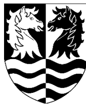
Ole Vive Borgmester Faxe Kommune