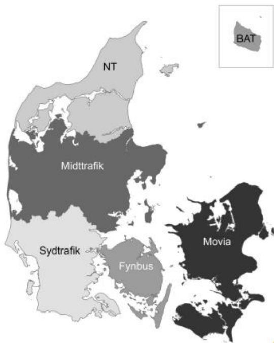
Figur 5 fra Trafikstyrelsen "Den kollektive trafik i Danmark", 2015

I model A er priser og regler for ungdomskort som i dag. Men i stedet for, at man kan rejse frit i et takstområde, udvides gyldigheden til at dække hele trafikelskabets område, jf. figuren til venstre.