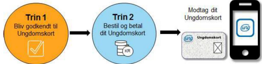
Figur 4 fra ungdomskort.dk

Først skal den unge indhente en godkendelse til at kunne købe et ungdomskort på ungdomskort.dk. Det kræver i ca. en tredjedel af tilfældene manuel sagsbehandling, hvorfor det kan tage tid.