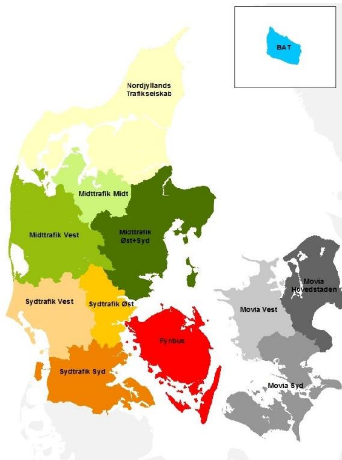
Figur 3 fra bekendtgørelse om ungdomskort

En ung, der bor i nabobyen St. Heddinge i Movia Hovedstaden, kan derimod rejse uden yderligere betaling i hele hovedstadsområdet.