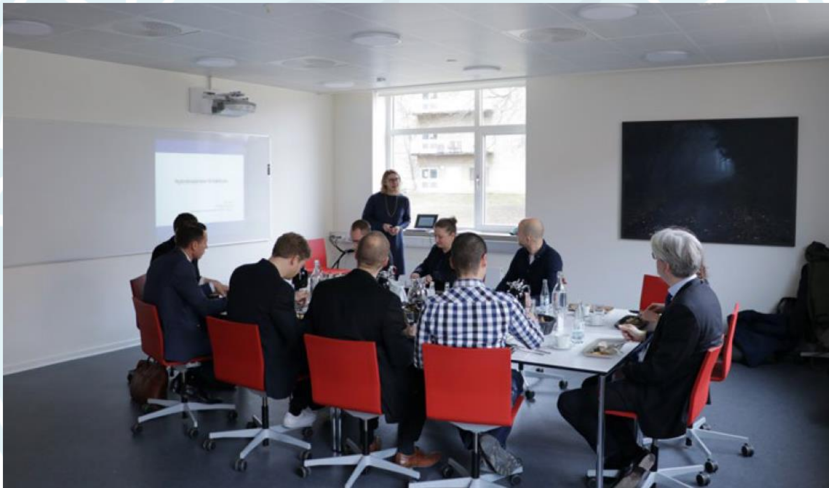
Daværende uddannelses- og forskningsminister, Søren Pind, mødes med en gruppe medlemmer af Det Unge Akademi.