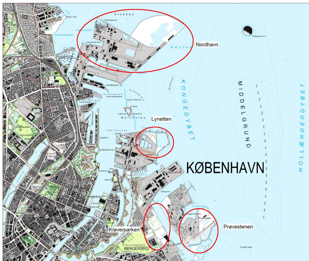
Figur 3. Bekræftede forekomstområder for grønbroget tudse i Københavns Havn i perioden 2020-2021.

Det overlades til jura-kyndig ekspertise at afklare placeringen af myndighedskompetencer i forhold til Lynetteholm. Umiddelbart må det dog forventes, at Staten ved administration af de internationale beskyttelsesbestemmelser er forpligtet til at overholde de samme kvalitetskrav som underordnede myndigheder.