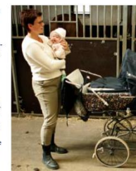
Hvis kvindelige ansatte i besætninger, der er under mistanke for q-feber bliver gravide, kan de sandsynligvis få barselsdage fra kommunen i mere end fire uger før fødsel.

“DET ER MIN VURDERING, at der i tilfælde af q-feber, som udgangspunkt er net til barselsfravær med dagpengene som følge af risikoen for fostret. I praksis er kommunerne dog noget