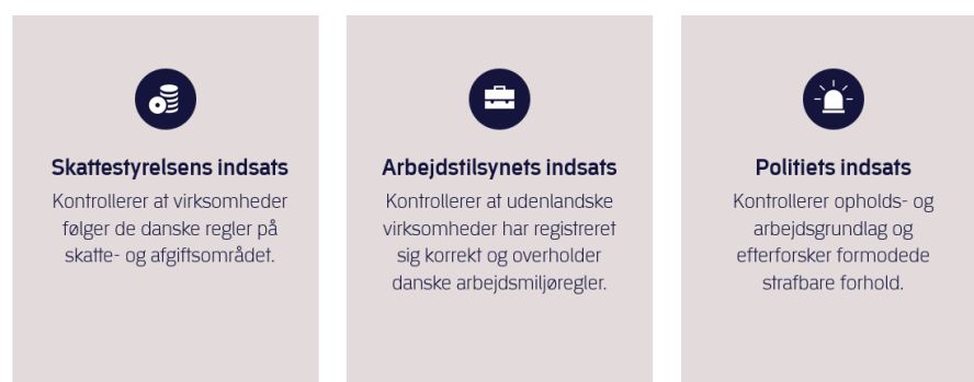
Figur 3. Eksempel på myndighedssamarbejde under fællesaktioner

Samtidig holder myndighederne tæt kontakt og underretter hinanden, hvis de på egne kontrolbesøg får mistanke om lovbrud på en af de andre myndigheders område. Samarbejdet har derfor medført, at Arbejdstilsynet, Skattestyrelsen og politiet løbende bliver bedre til at understøtte hinandens indsatser og sikrer en fortsat effektiv og målrettet kontrol.