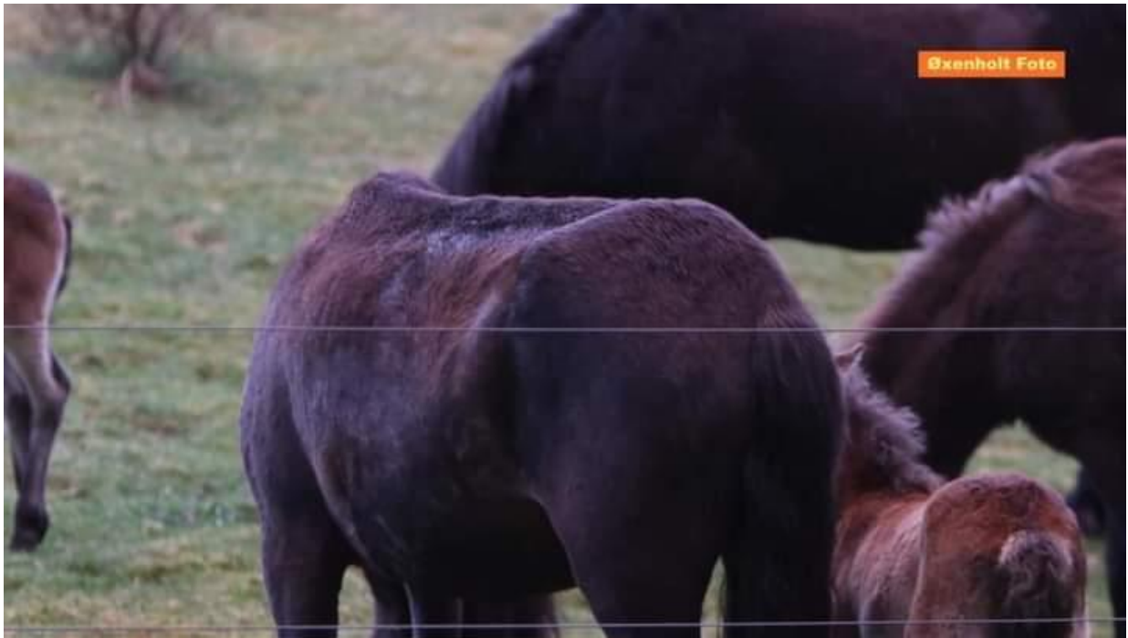
Her ses samme hoppe maj 2021