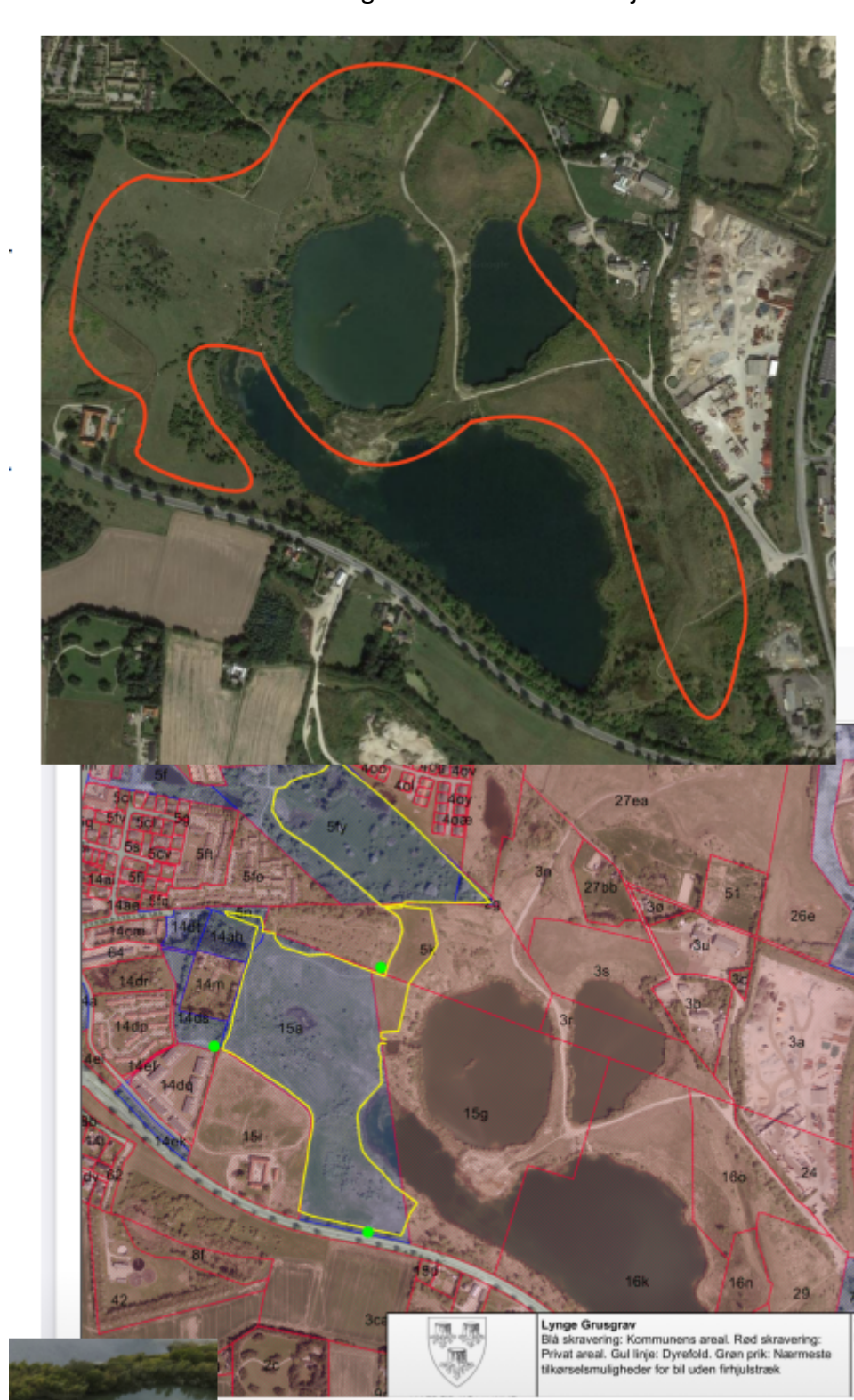
Figur 3: Forslag til kommunaltejede områder, der kan indgå i Disc Golfbane ved Lyngre Grusgrav.

Lyngre Grusgrav er omfattet af lokalplan 332. Det vurderes umiddelbart at der inden for Lokalplanens rammer kan etableres en Disc golfbane. Kommunen ejer en del af den veslige del af Lyngre Grusgrav.