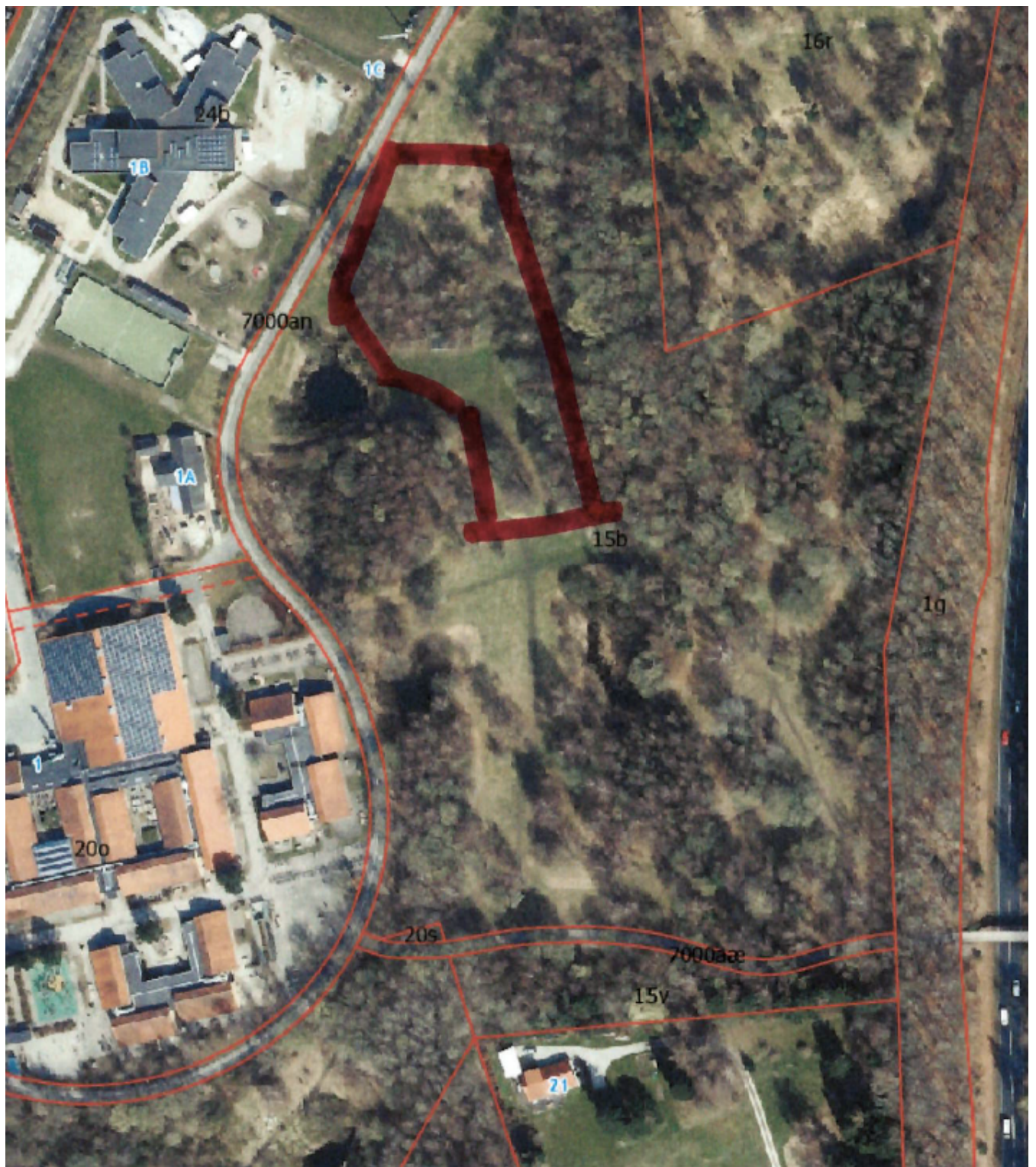
Figur 2: DN Allerøds forslag til områdeafgrænsning.