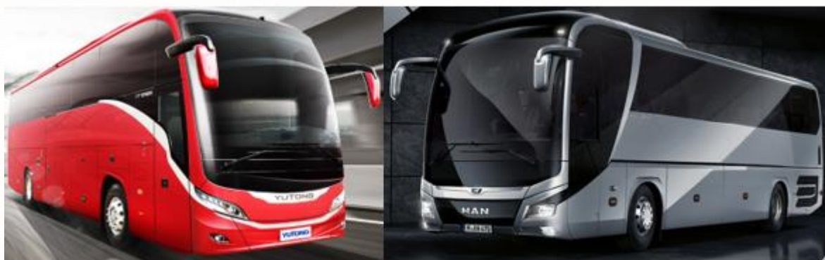
Yutong T12E (ca. 4 mio. kr.)