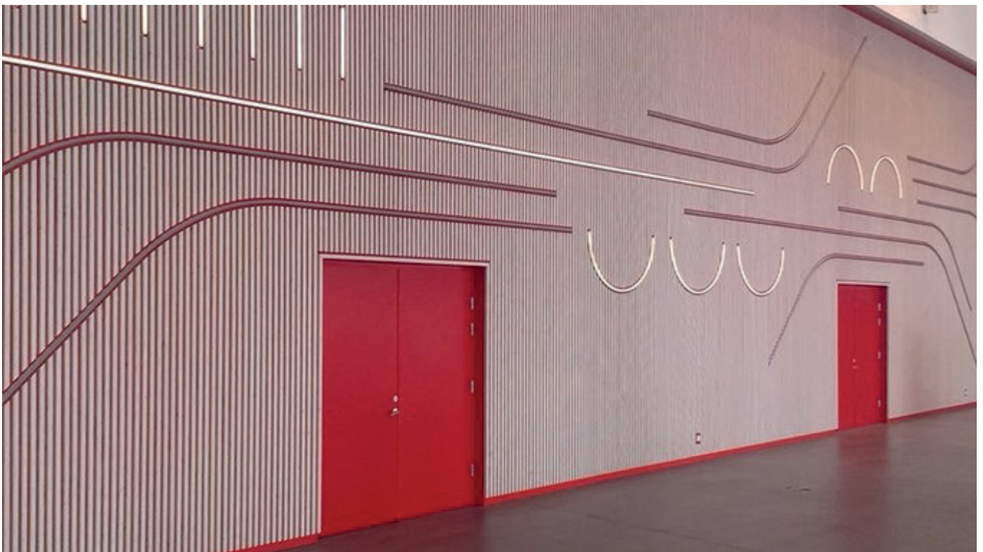
Syddansk Universitet, Campus Kolding, kunstner Tobias Rehberger.

Samtidig bør man forpligte regioner og kommuner til at følge samme praksis som staten på dette område. Et opdateret, tidssvarende kunstcirkulære vil give flere borgere i hele landet mulighed for at opleve alt det, kunsten kan give os: Nye erkendelser, øget lokalforankring, meningsfulde møder og oplevelser i vores fælles, offentlige rum.